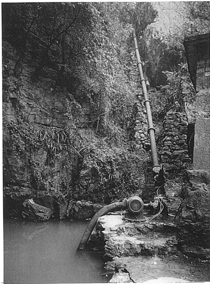
白宝郷 ポンプ灌漑施設