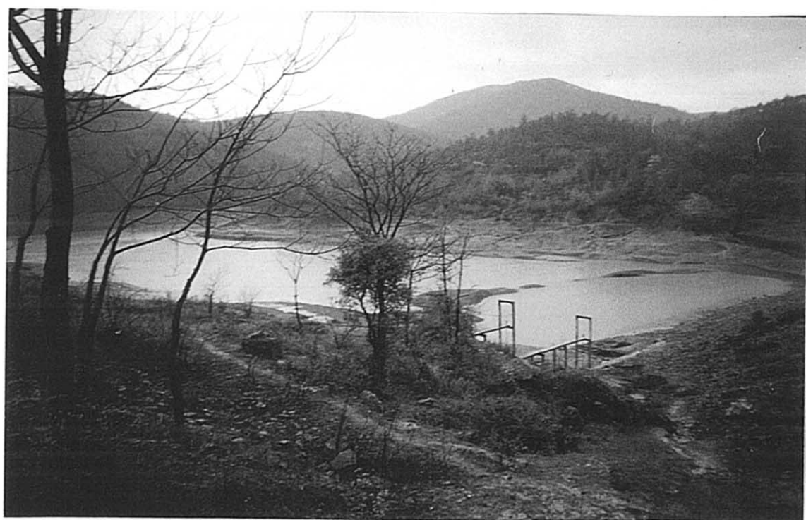
両河郷 百板洞ダム全景