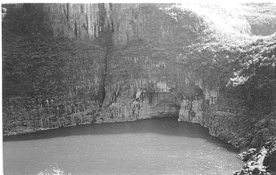
白宝郷 弄岩ダム その1