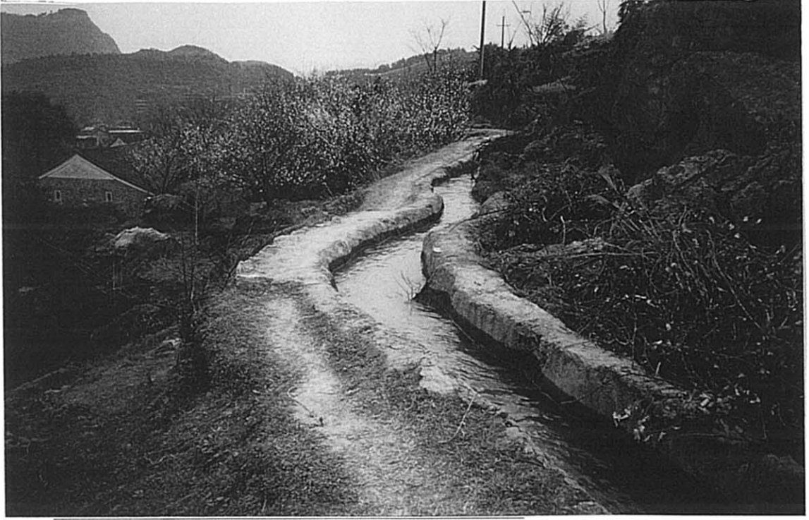
白宝郷 既設灌漑水路（石積フリュームタイプ） 山岳部