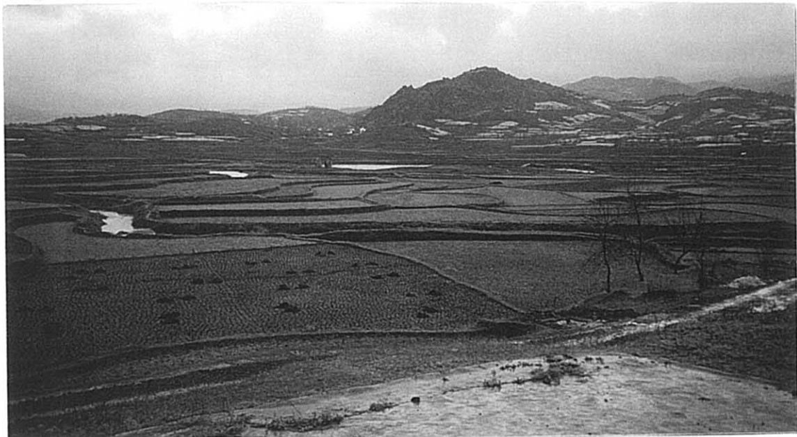
白宝郷 平野部灌漑地区全景