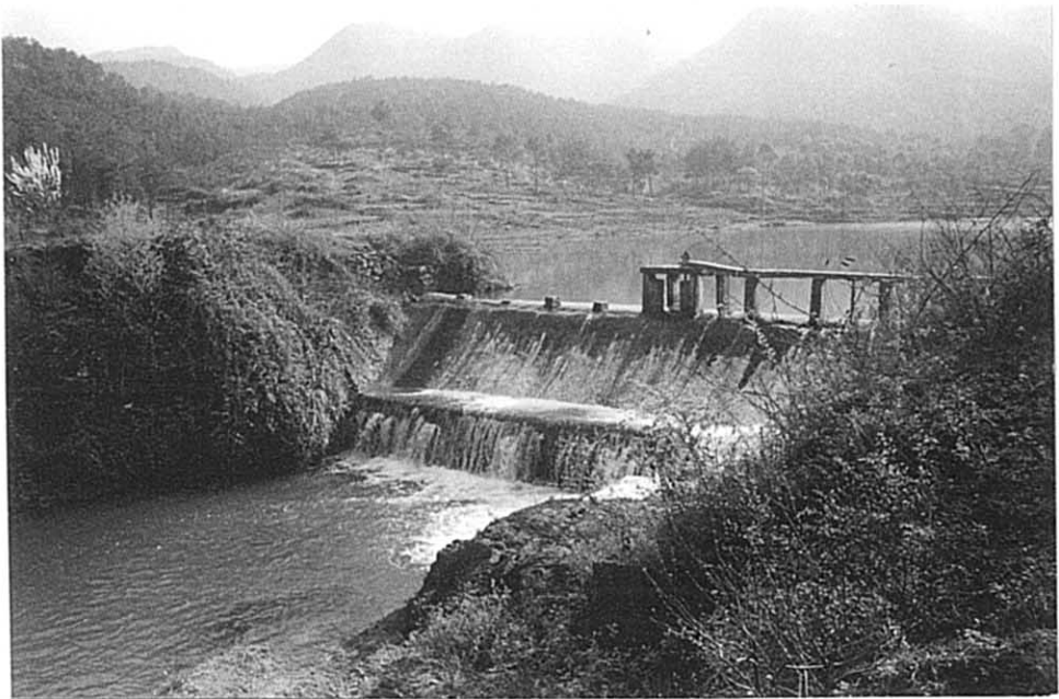
城郊郷 河川からの取水堰