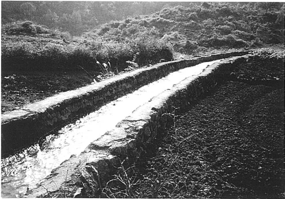
白宝郷 既設灌漑水路（石積フリュームタイプ） 平地部