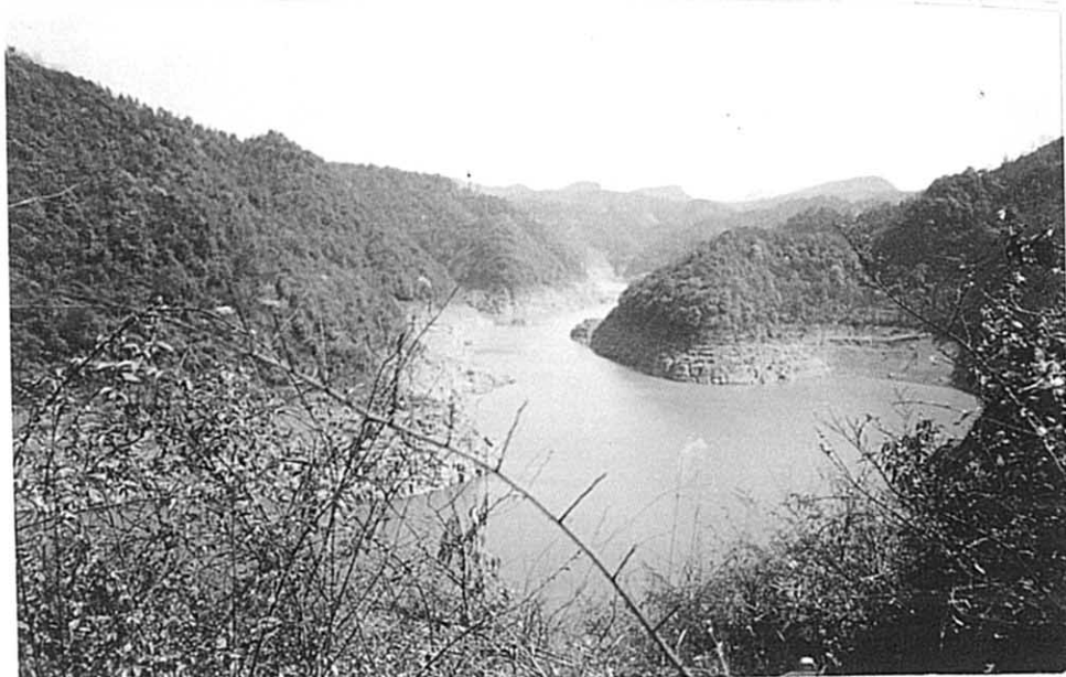
白宝郷 弄岩ダム その2