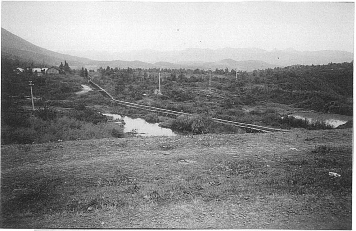
東山郷 既設灌漑水路（フリュームタイプ・石積）