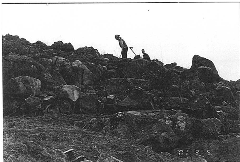
白宝郷 カルスト地形開墾風景