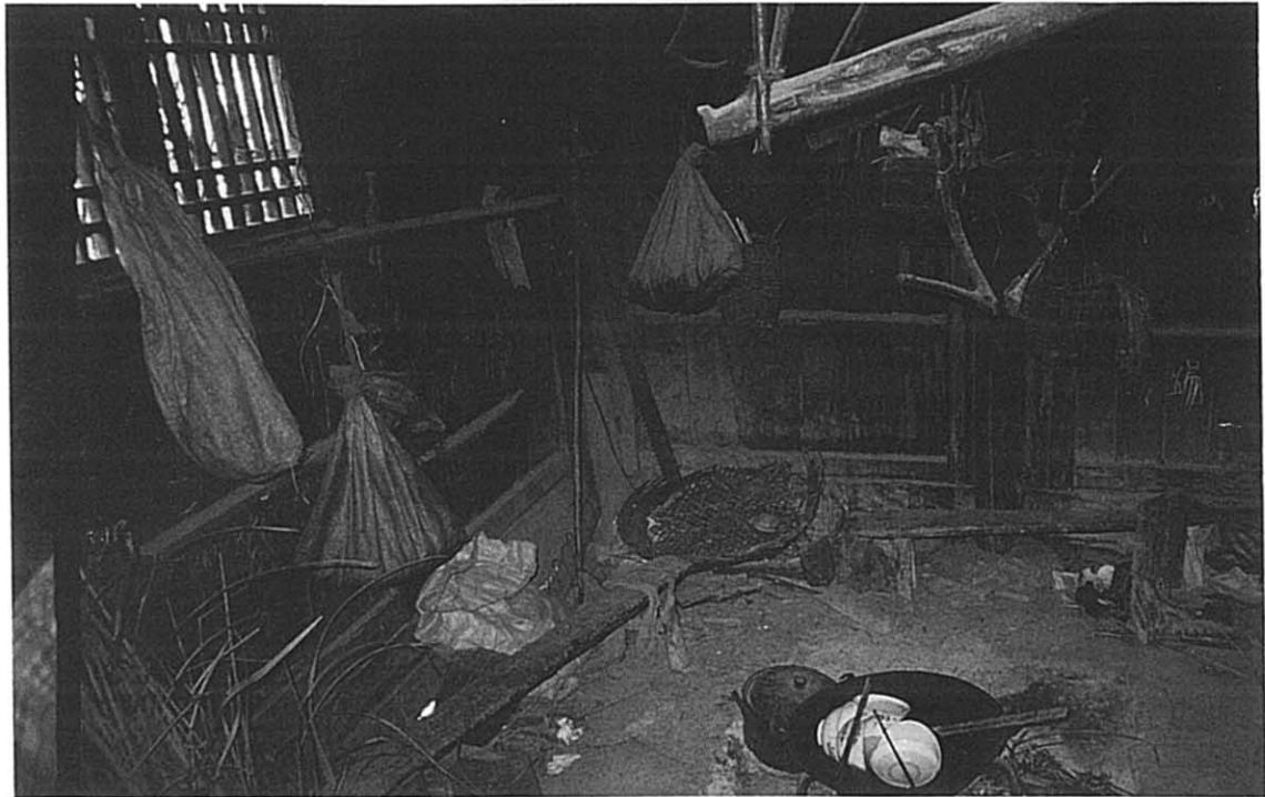
東山郷 民家の居間