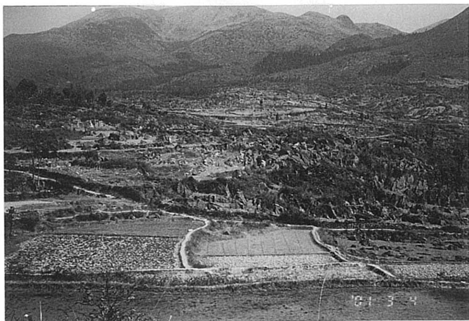
東山郷 カルスト地形による耕地