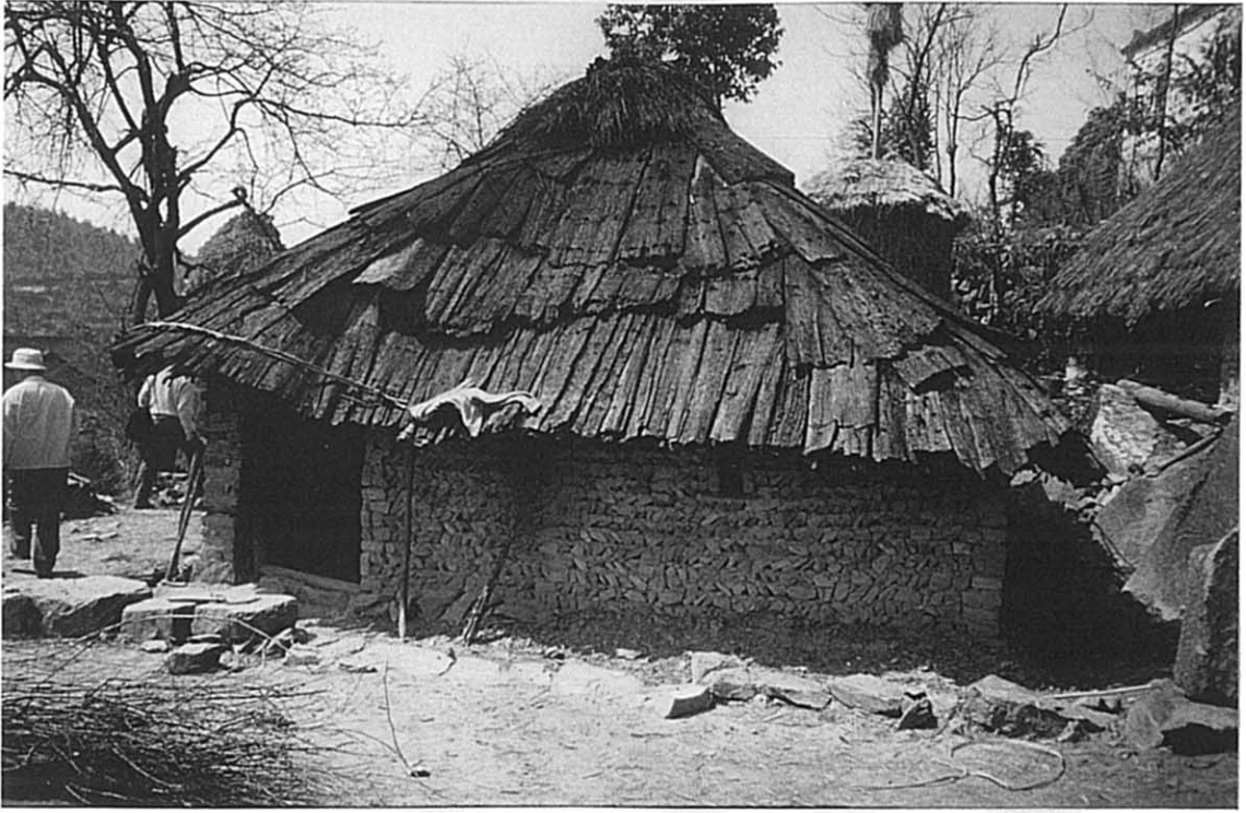
東山郷 一般的民家