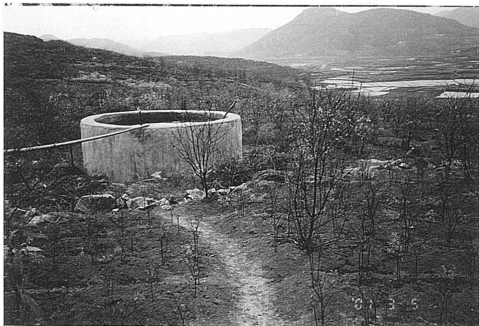
白宝郷 同上、補助水槽と灌漑エリア