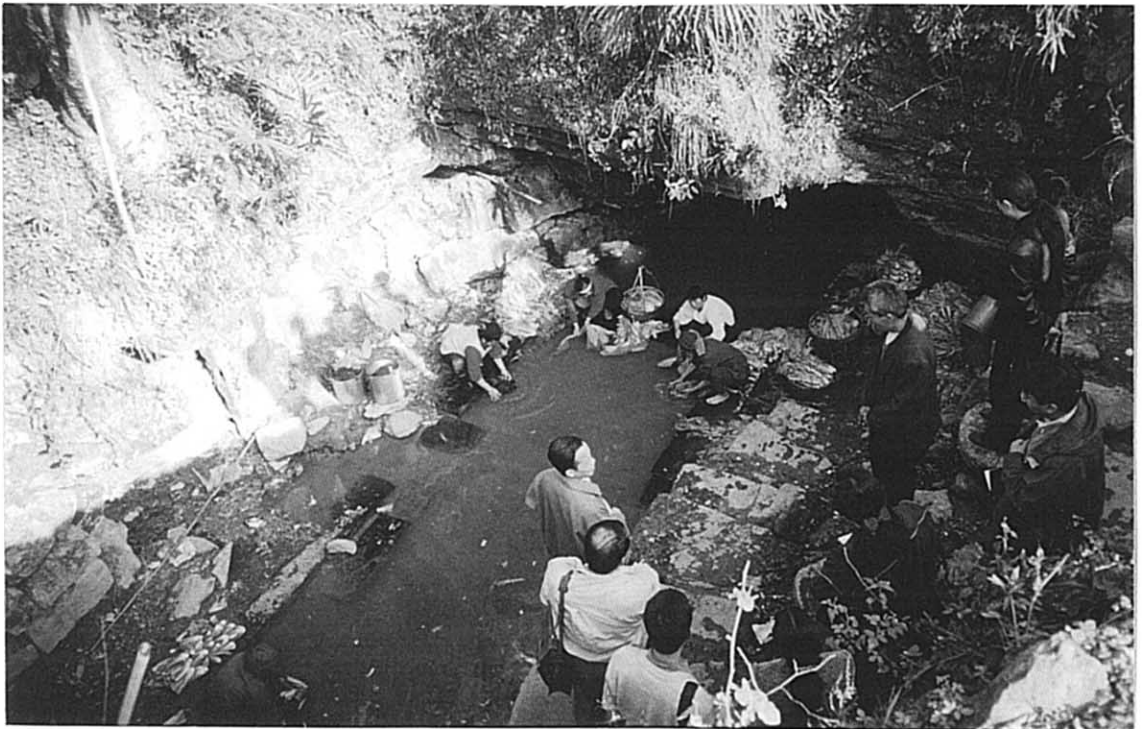
東山郷 地下水からの流水による生活用水