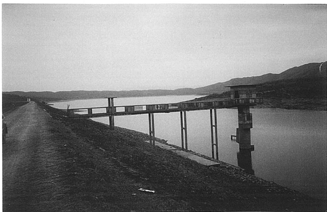
東山郷 上坪ダム全景