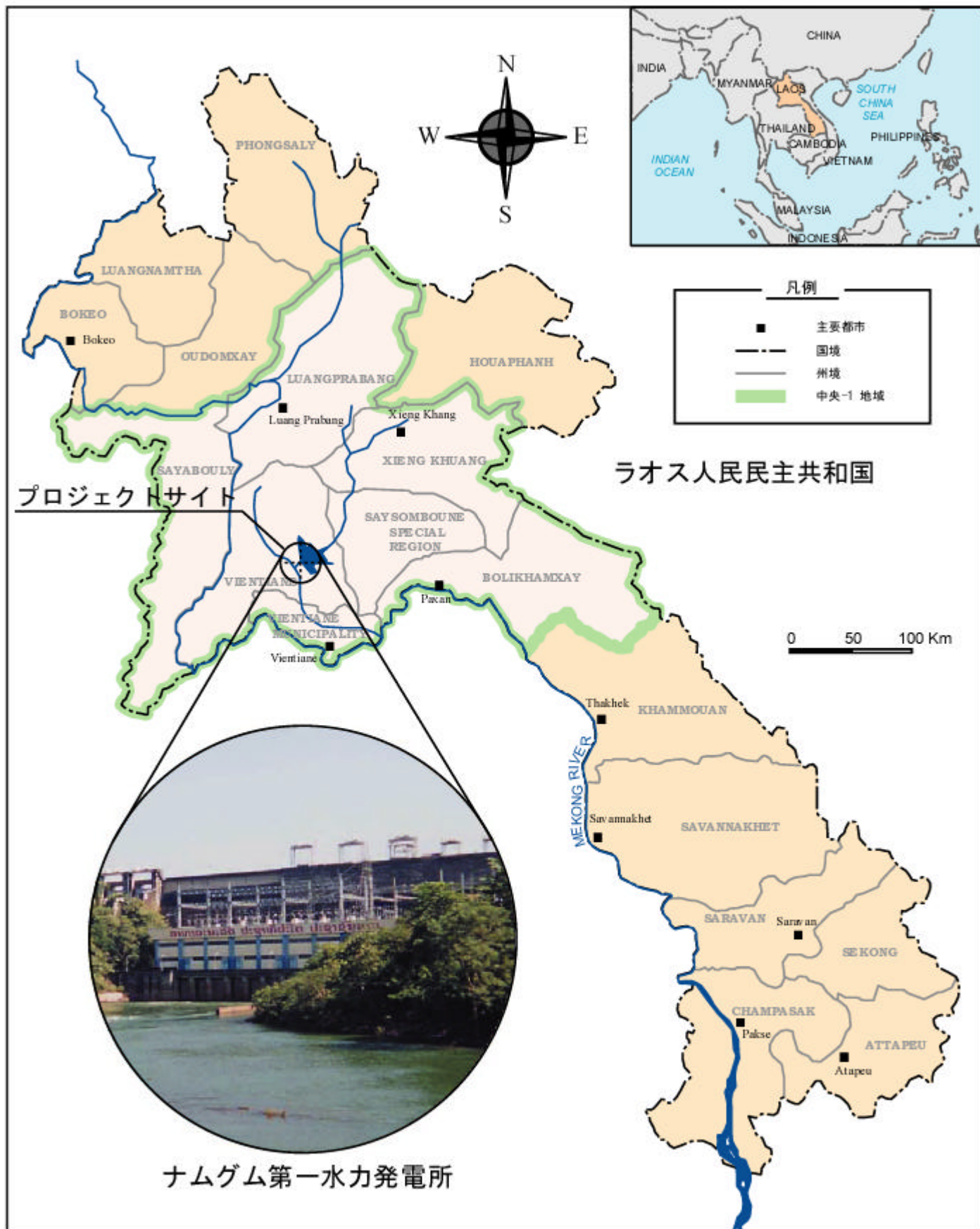
プロジェクトの位置図