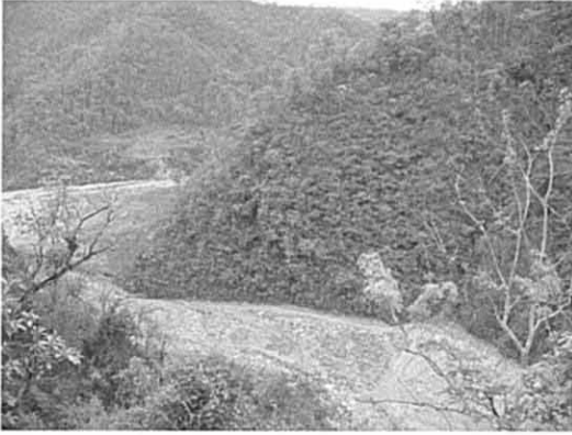
ヤンラン川最下流部