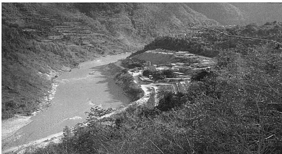
カリガンダキ-A 発電施設工事現場