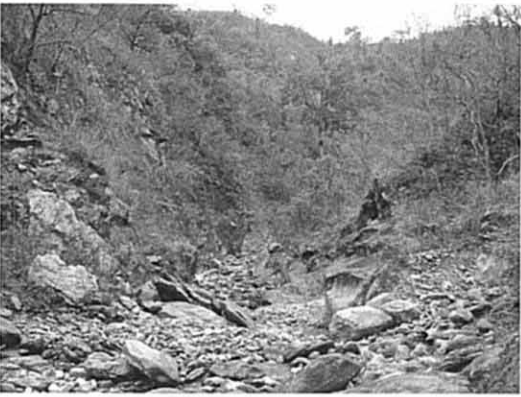
調整池予定地（上流側より）