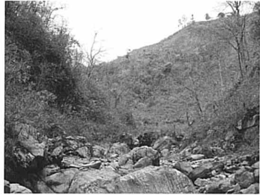
調整池予定地（下流側より）