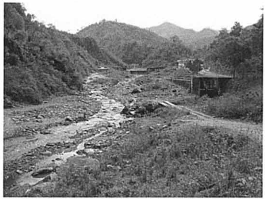
カニ川取水予定地点