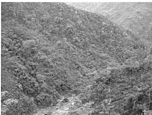
ヤンラン川流域（調整池下流）