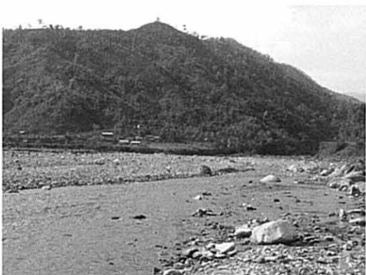
建設キャンプ予定地