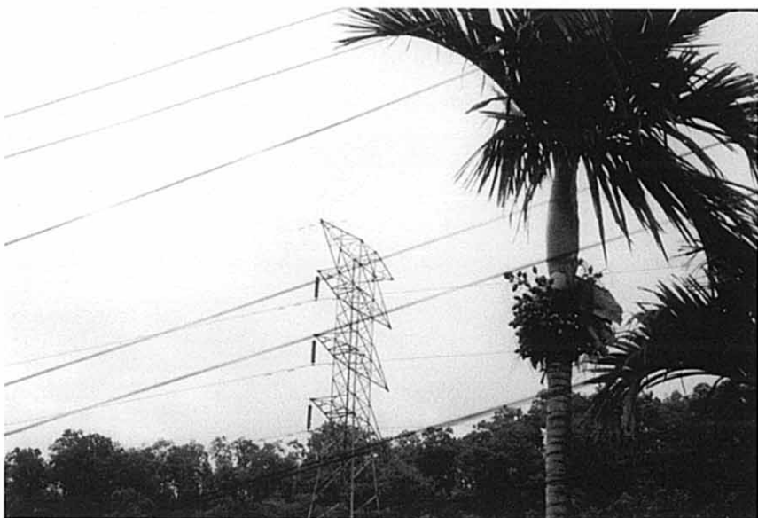
既存送電線： 片側しか電線が張られていない