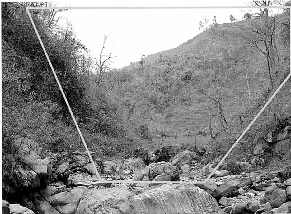
ダム建設予定地 (Yangrang Khola)