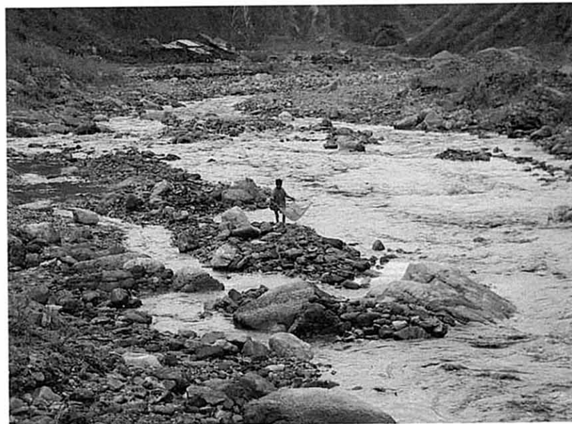
取水施設下流域 (Khani Khola)