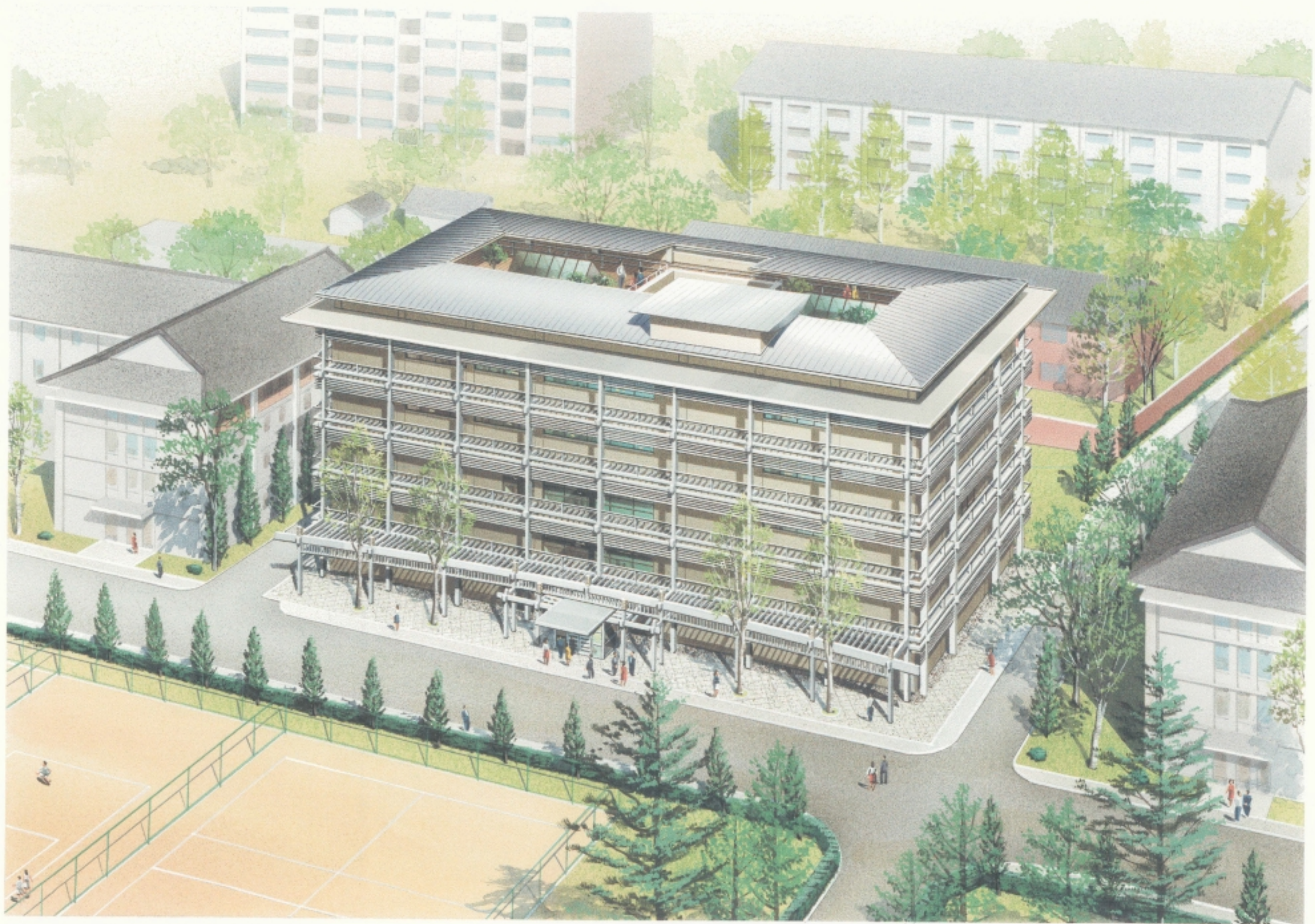
THE PROJECT FOR THE DEVELOPMENT OF THE BEIJING CENTER FOR JAPANESE STUDIES IN THE PEOPLE'S REPUBLIC OF CHINA