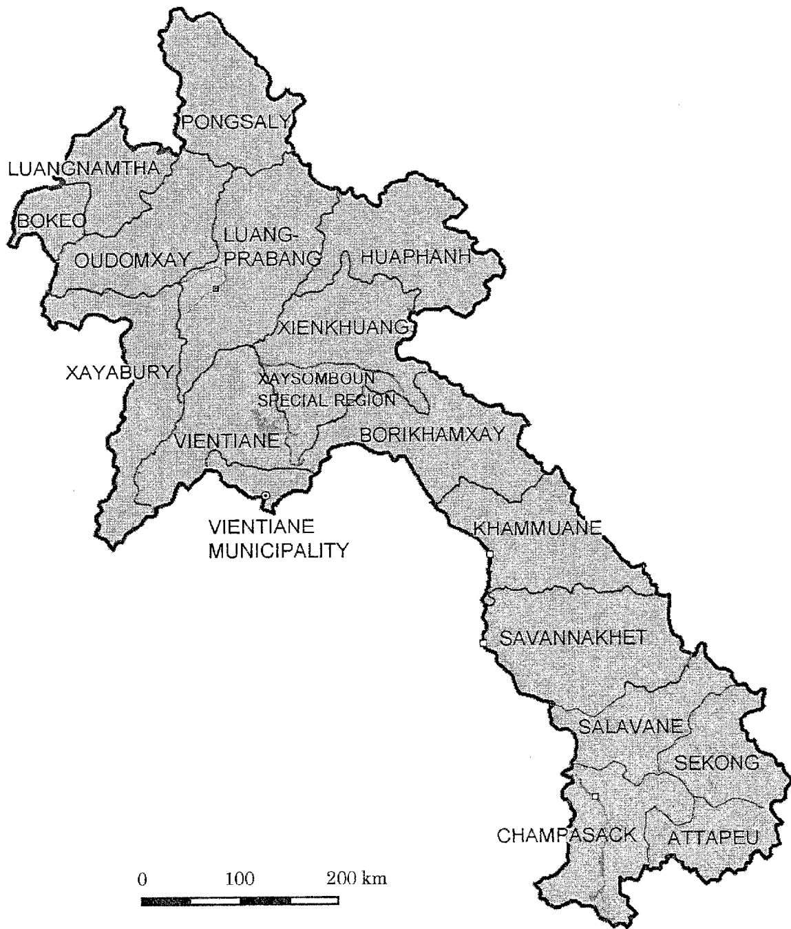
ラオス人民民主共和国全図