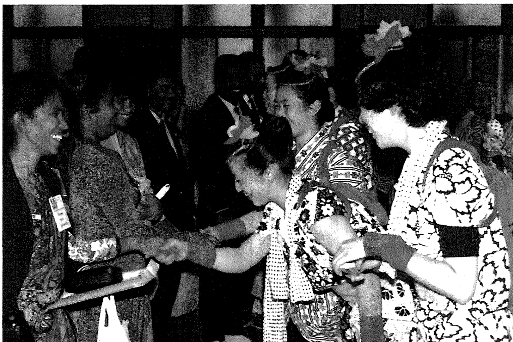
歓送会(国内/青年招へい)