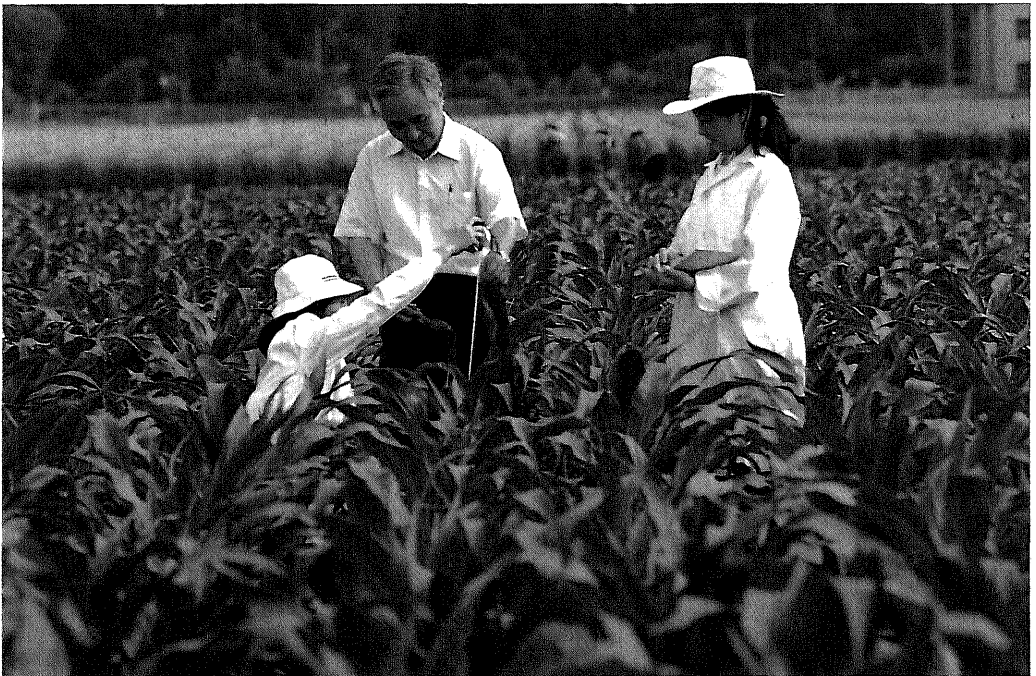
三江平原農業総合試験場(中国/プロジェクト方式技術協力)