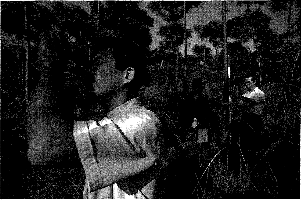
森林造成計画(パラグアイ/プロジェクト方式技術協力)