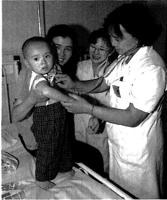
日中友好病院で働く看護の専門家 (中国/技術協力専門家派遣)