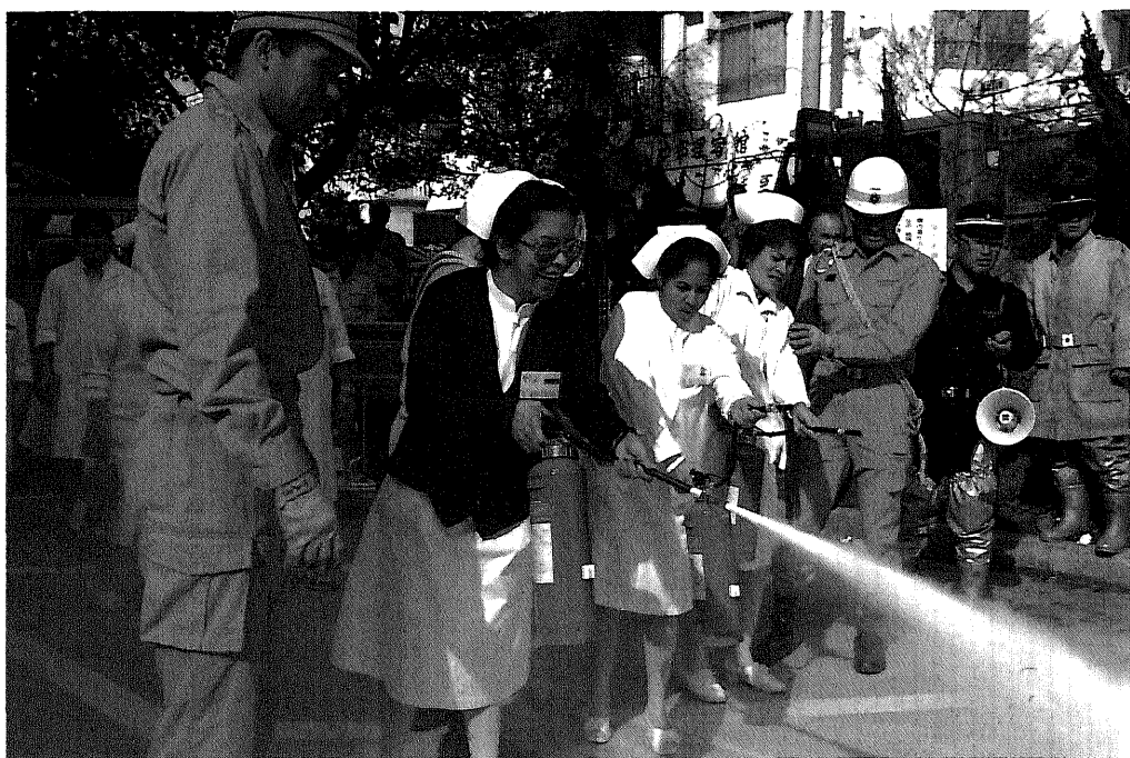
臨床看護実務コース 防火訓練(沖縄センター/技術研修員受入)