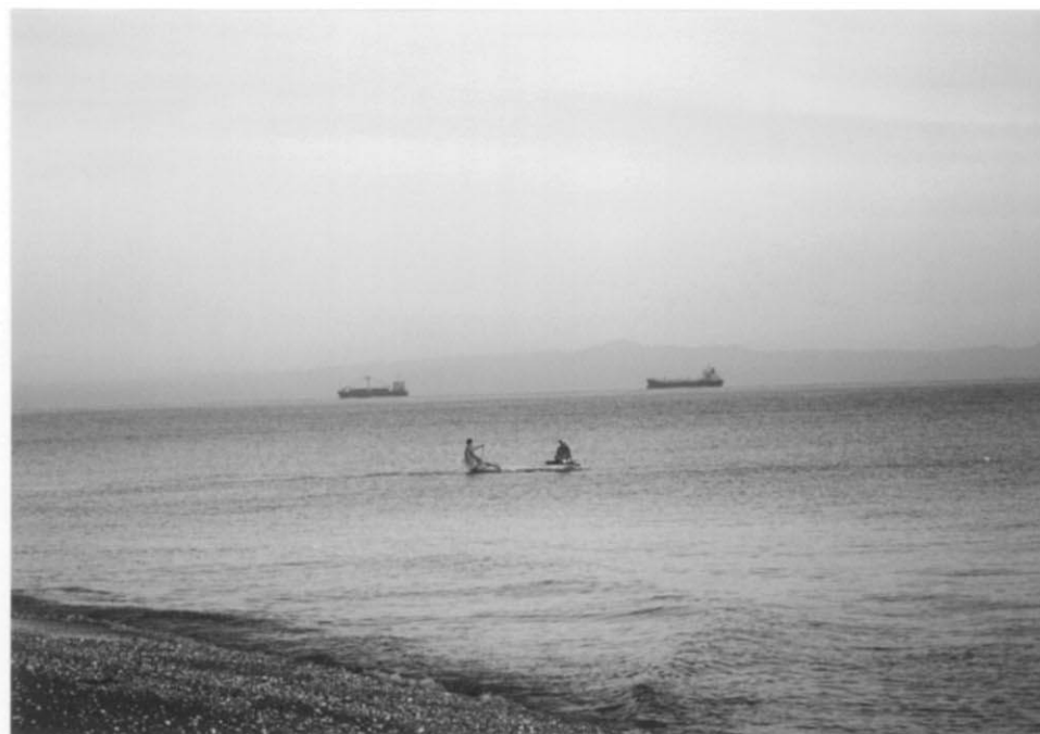
ディリ市内海辺の風景