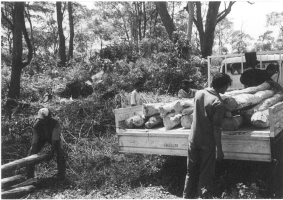
NGO がコミュニティホー ルを建設中