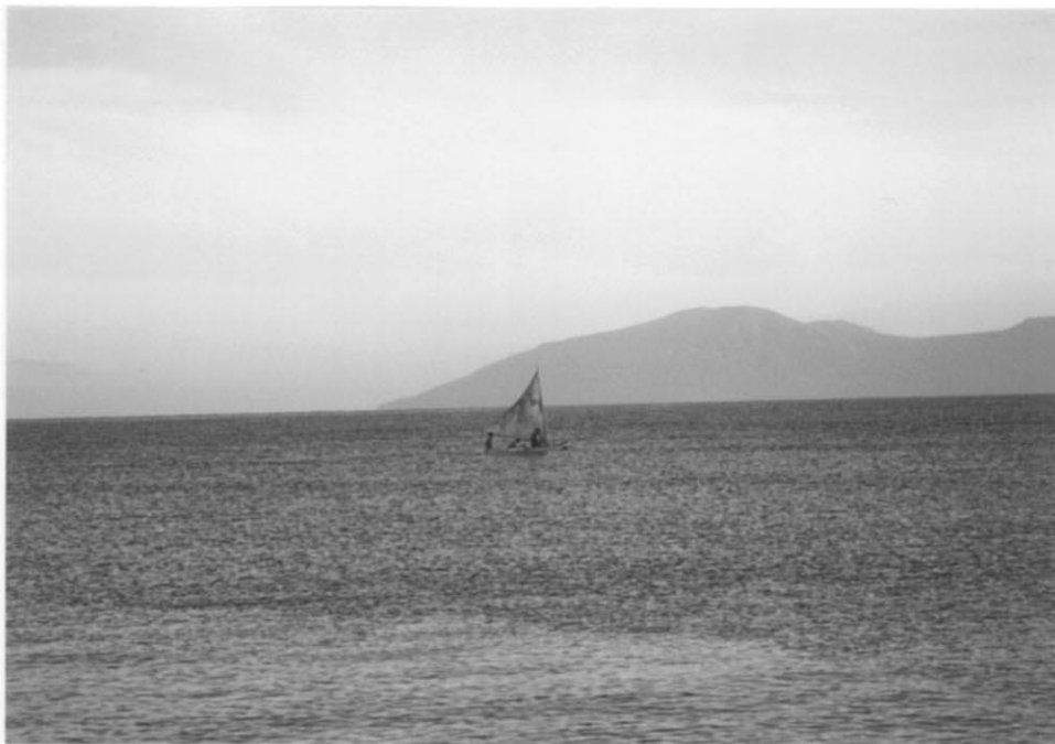
ディリ市内海辺の風景