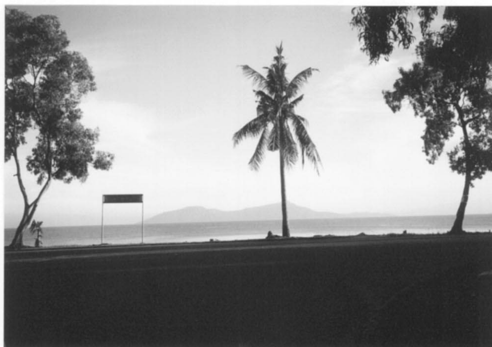
ディリ市内海辺の風景