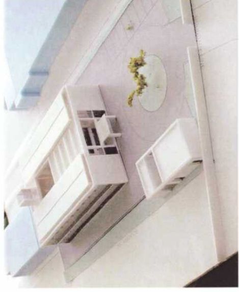
イエメン国南部イエメン結核対策拡充計画 模型写真