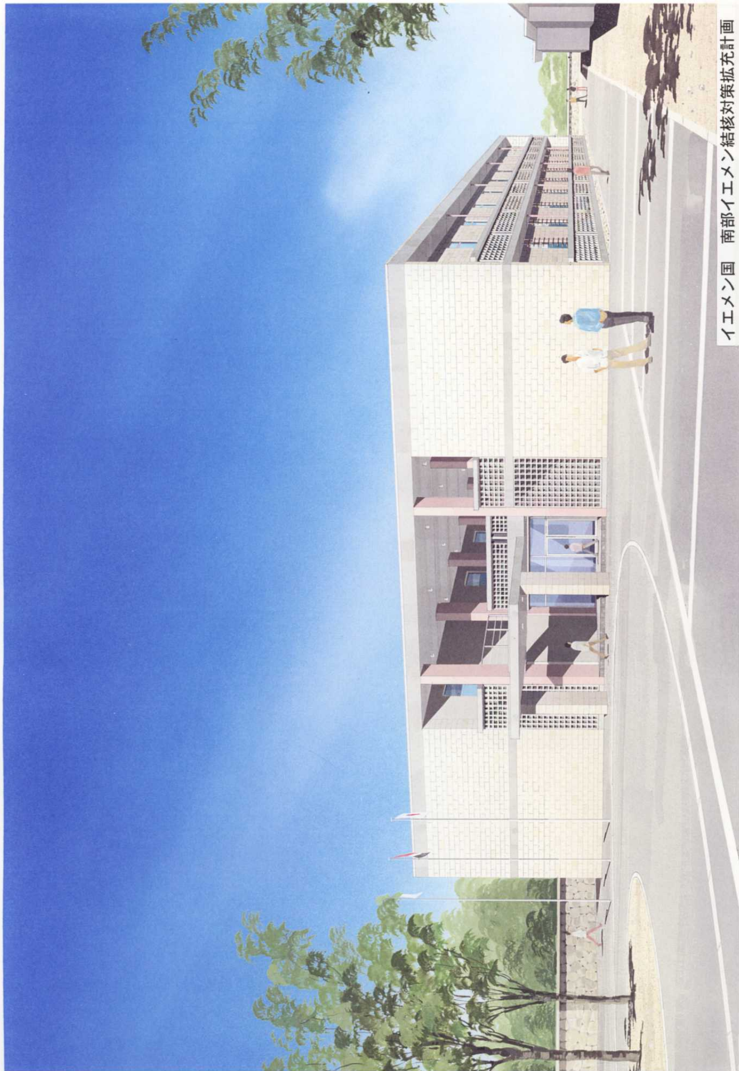
イエメン国 南部イエメン結核対策拡充計画