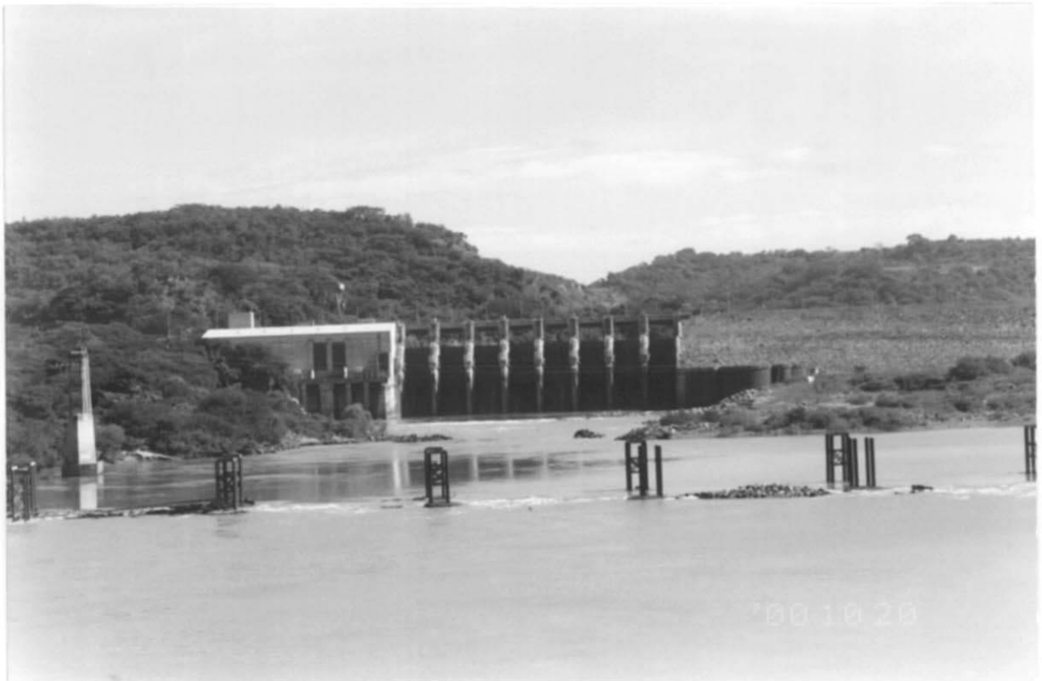
写真2. キンセ・デ・セプティエンブレダム