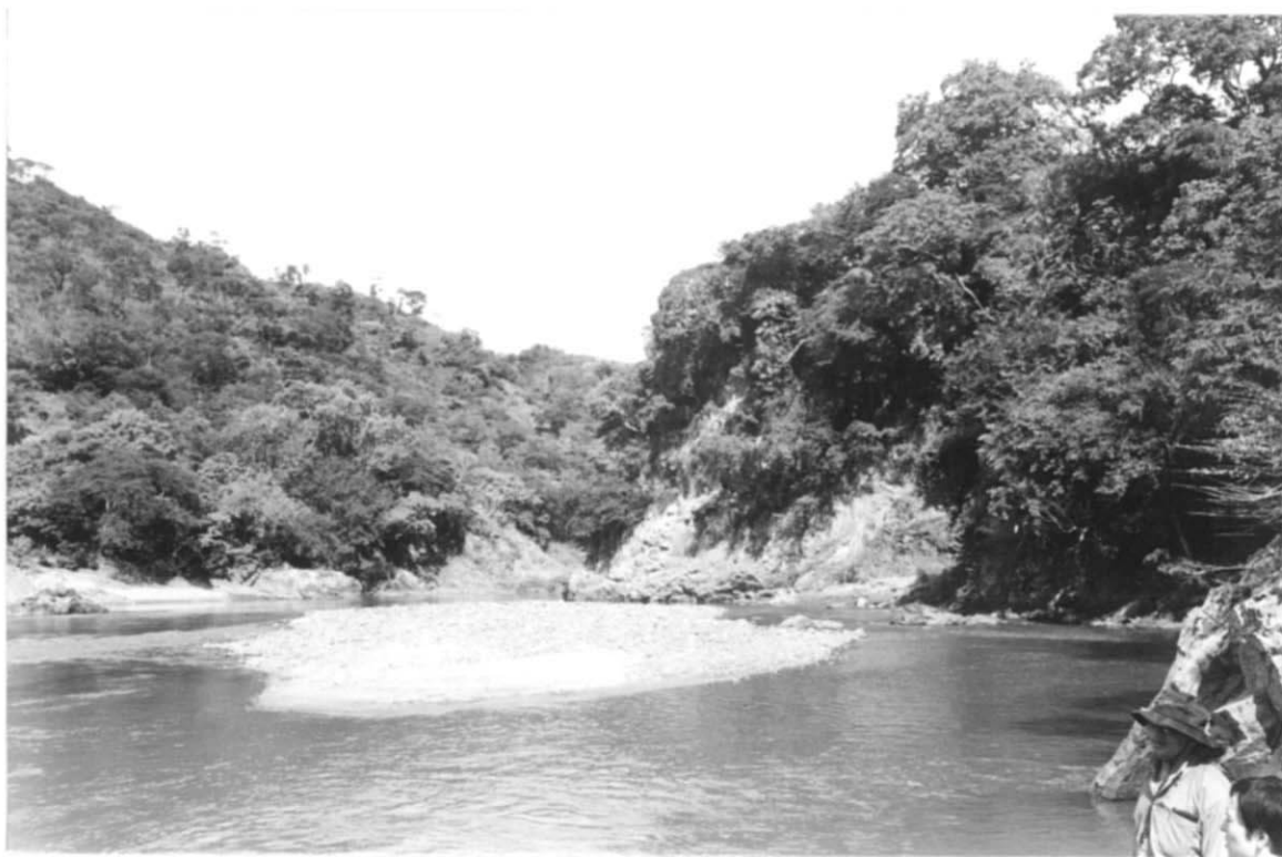
写真4. ラ・オンダ計画地点