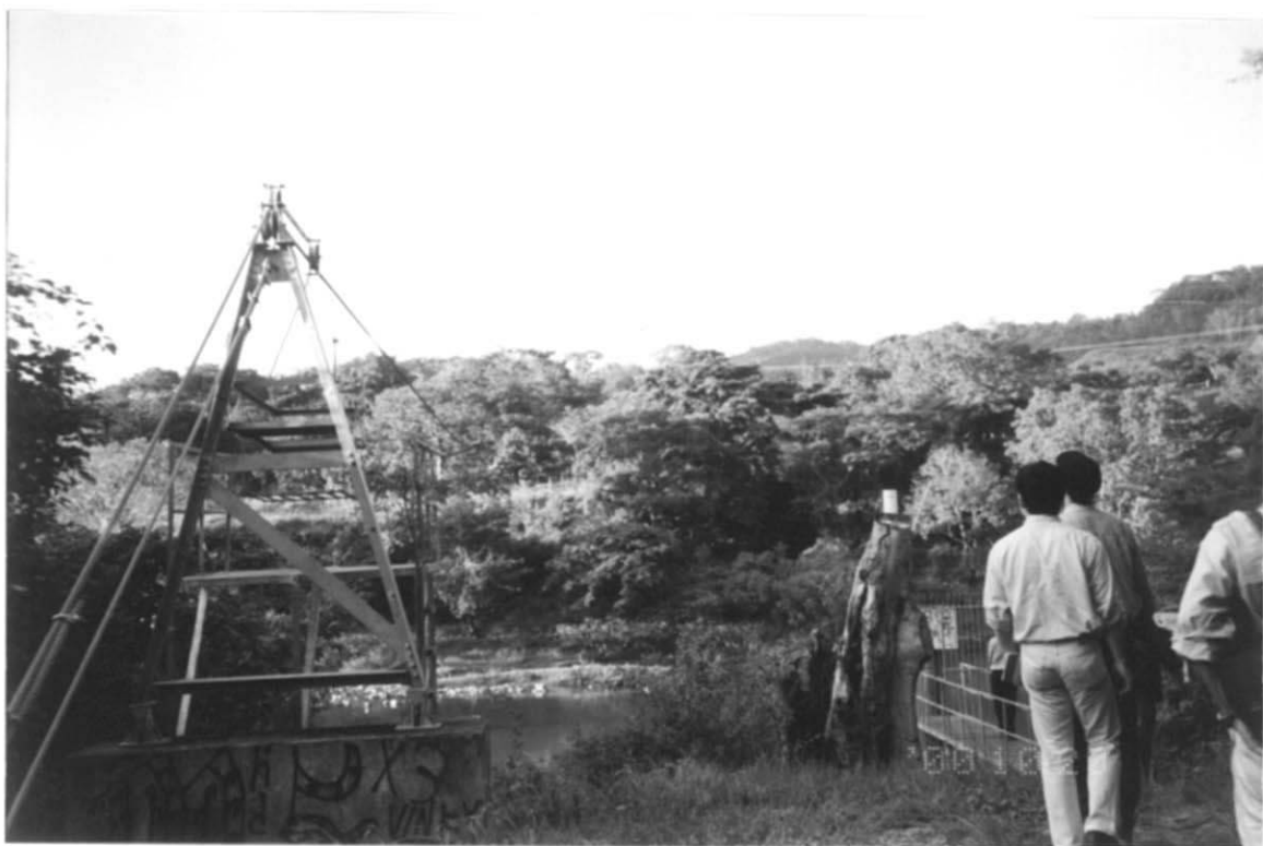
写真3. オシカラ水文観測所