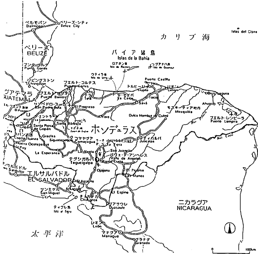
<ホンデユラス国全図>