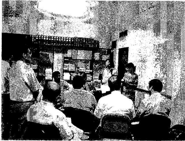
写真2 ホンデュラス国側関係者参加によるワークショップ