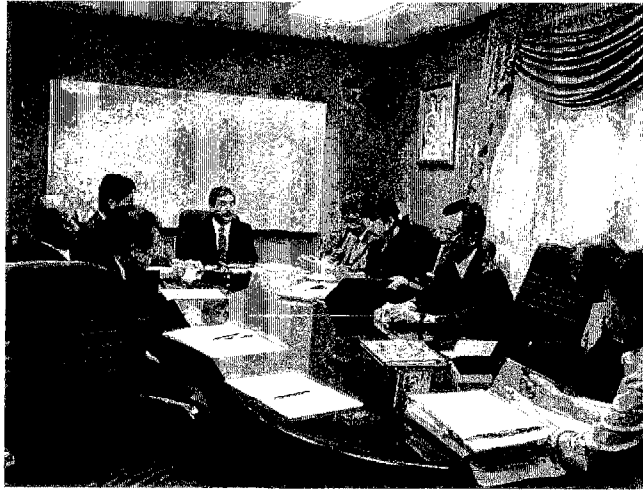
写真1 公共事業運輸住宅省での協議