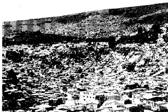
写真9 テグシガルパ市の斜面上に広がる住宅