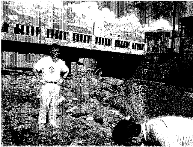
写真5 チキート川とチョルテカ川の合流部