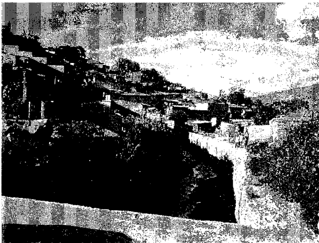
写真6 サボ溪流沿いのサボ地区