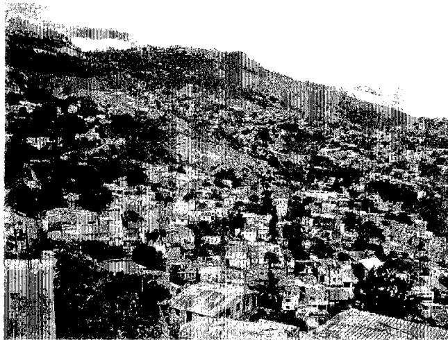
写真8 レバルト地区の地滑り全景