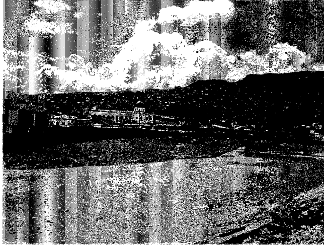
写真4 チョルテカ川とペリンチェ地区の地滑り