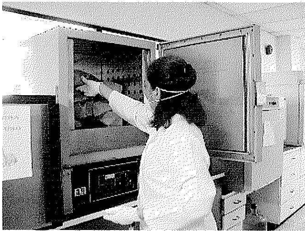
Se midió el contenido de humedad de los residuos.