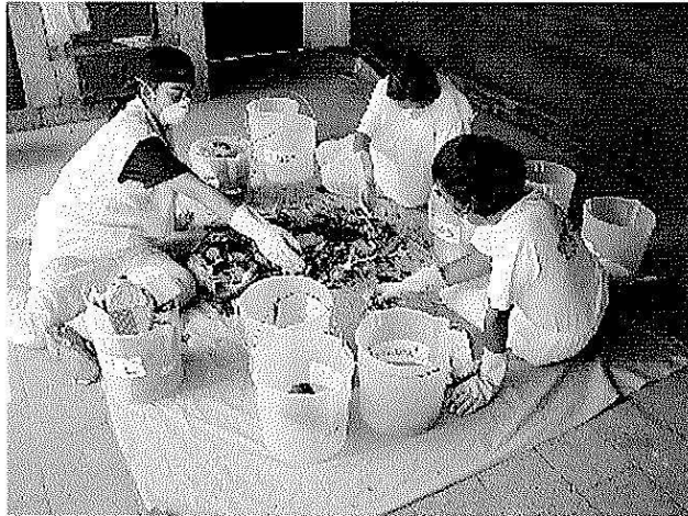
Las muestras se dividieron en 10 componentes.