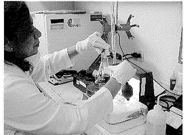
Se analizó el contenido de carbono y nitrógeno de los residuos.