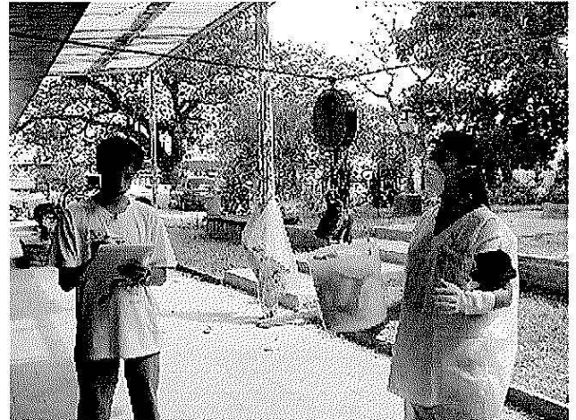
Las muestras divididas en 10 componentes se pesaron individualmente.