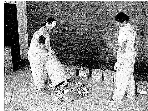
Análisis de la composición física de las muestras de residuos