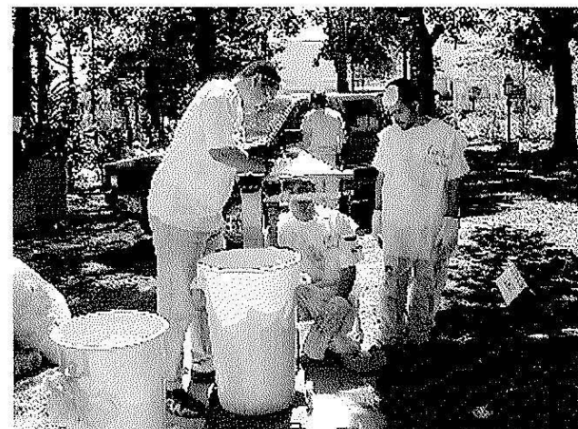
Las muestras se pusieron en una cubeta plástica de medición para registrar su volumen y peso.