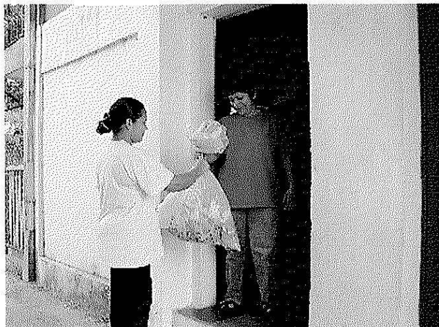
Recolección de muestras de residuos domésticos