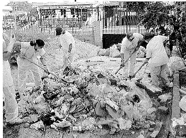
Mezclado de las muestras recolectadas de residuos