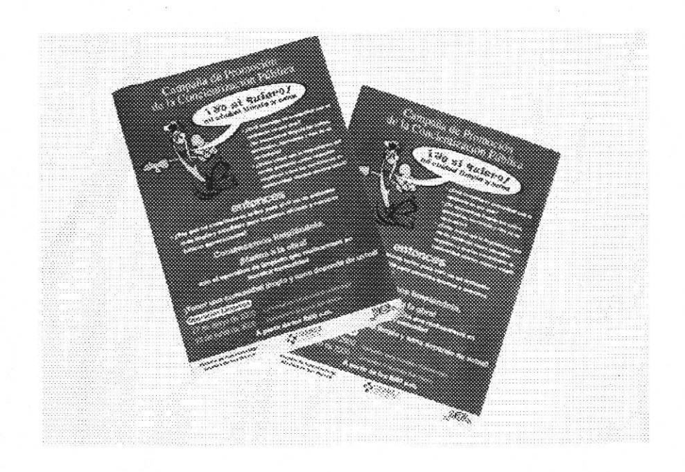
Leaflets distributed in Maria Auxiliadora and 10 de Octubre

2000 leaflets were distributed in the pilot project areas (Maria Auxiliadora: 800 and 10 de Octubre: 1,200) to encourage resident's cooperation in the clean-up activites.