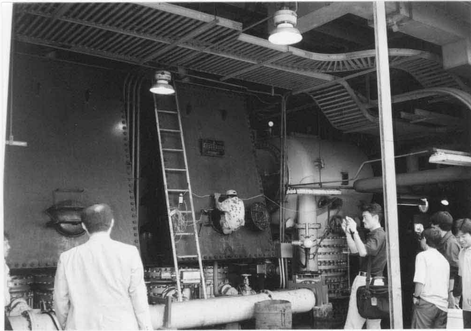
復水器 (Muara Karang 発電所 2号機)