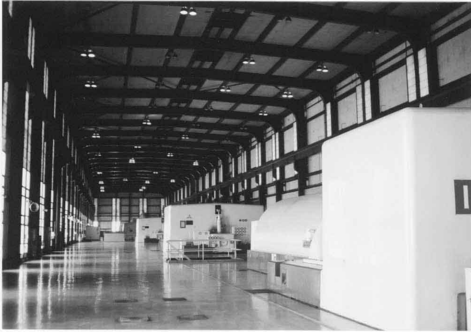
タービン・発電機室全景（三菱製）