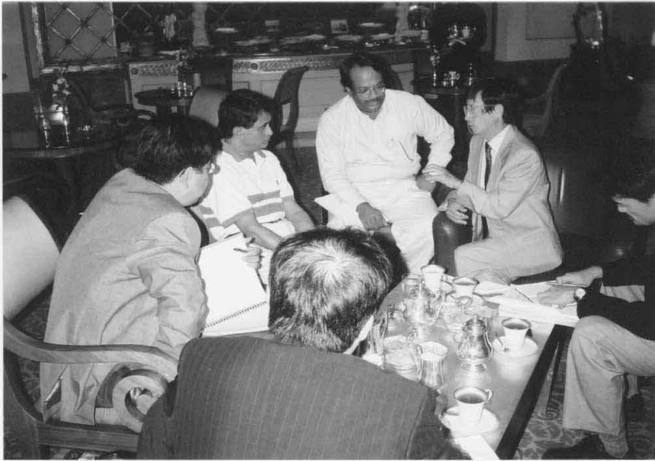
ADB (Mission from Manila)との協議