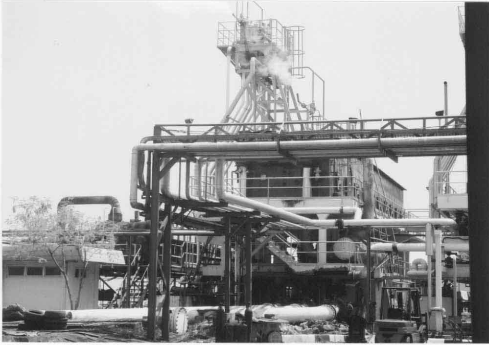
蒸気タービン用の蒸留水を作るプラント