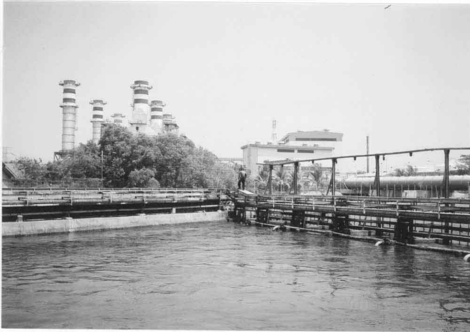
LNG コンバインド火力6～7号機