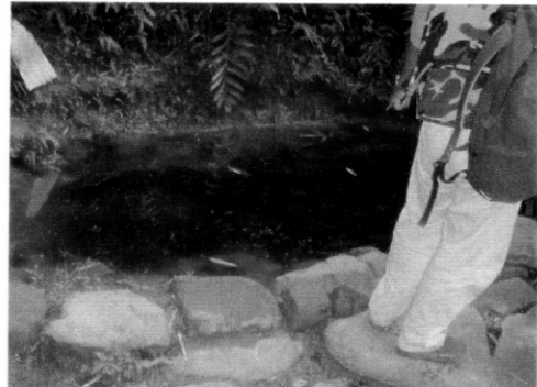
アッパーニョクワン村。 湧水を溜めた水場。浮遊物が多い。