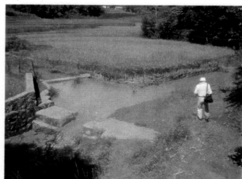
コンパオチャイン村。 濁度の高い水を使用している。