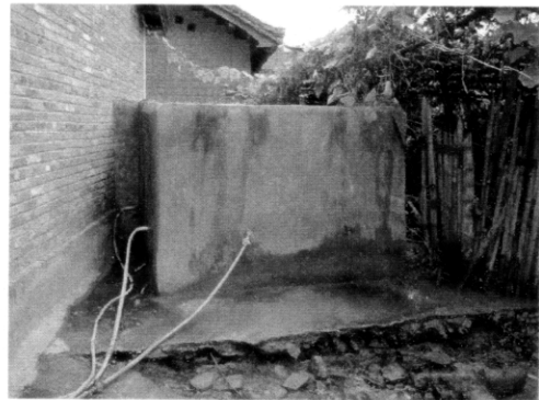
ロートンコー村。既存タンク。 ホースをつないで各戸に分配している。