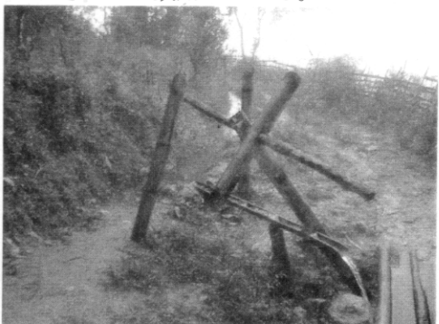
ターシャン村。水源から水路を掘り、 竹を組んで、水場になっている。