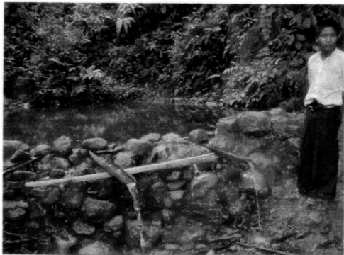
ローアーマンサー村。 簡易な水場、住民は煮沸せず、 そのまま飲用している。