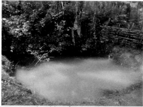
シンカイ村。パラウン集落水場。 水質は劣悪である。