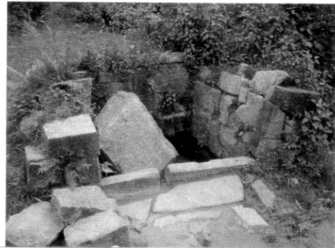
チューサイ村。コーカン集落水場。 石積が崩れたまま放置されている。