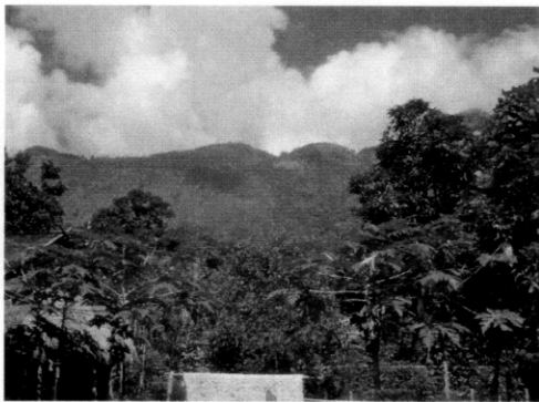
村落背面に連なる山。水源候補地 ある (ヘーホー村)。