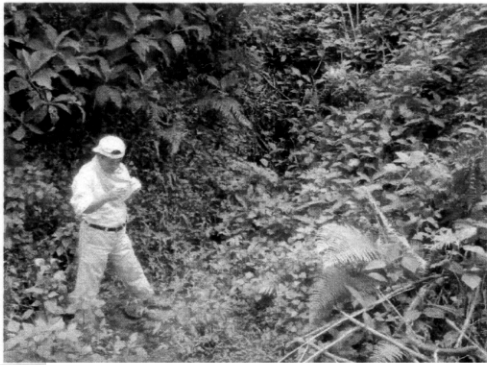
水源候補地の水質検査 (チャーシーシュ村)。