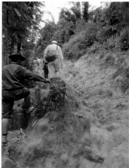
調査対象村内の移動。 水場へ通じる道は、険しい上に ぬかるんでおり、移動に苦勞する。 水汲み労働は、困難を極め ると考える (マンモー村)。