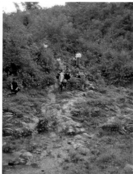
調査対象村内の移動。 水場へ通じる道は、岩も多く、 登り下りに危険を感じる個所も有 る (アッパーマンサー村)。