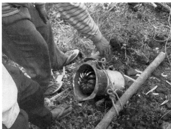
中国から買ってきた100Wの水車発電機 この人達が小水力の維持管理を引き受けてくれるだろう]