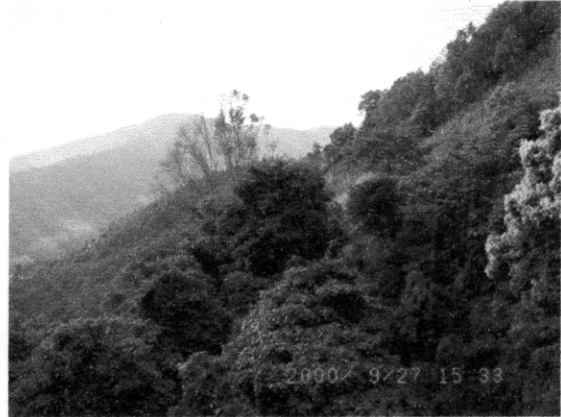
タモホー地点，サルウイーンに向かって 急激に落ち込む，人跡未踏