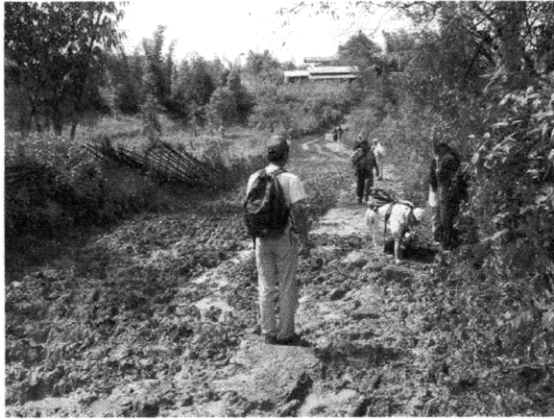
チャーシーシュへの悪路，車通行不能