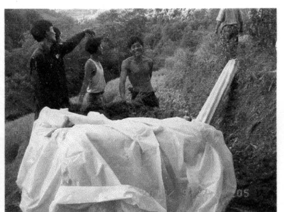
100Wの水力発電に挑む村の青年達