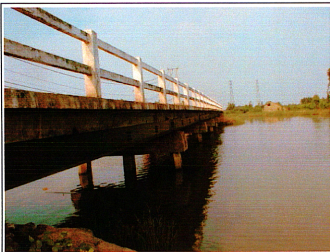
写真 1 : 現橋