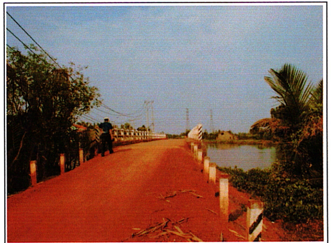
写真 2 : 現橋