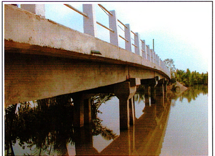
写真 2 : 完成済み橋梁 (2)