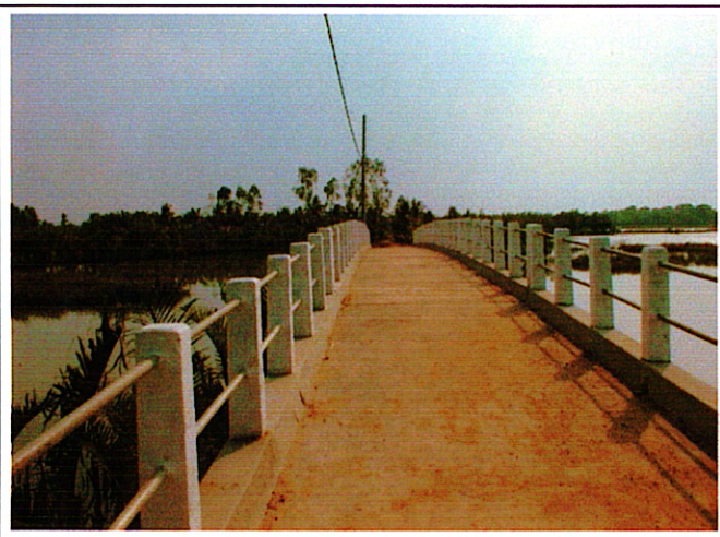
写真 1 : 完成済み橋梁 (1)