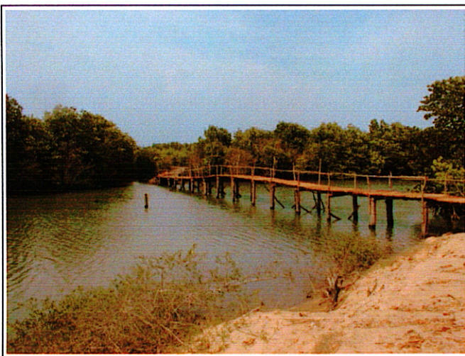
写真 1 : 仮設橋