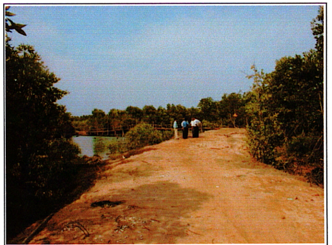
写真 2 : 仮設橋