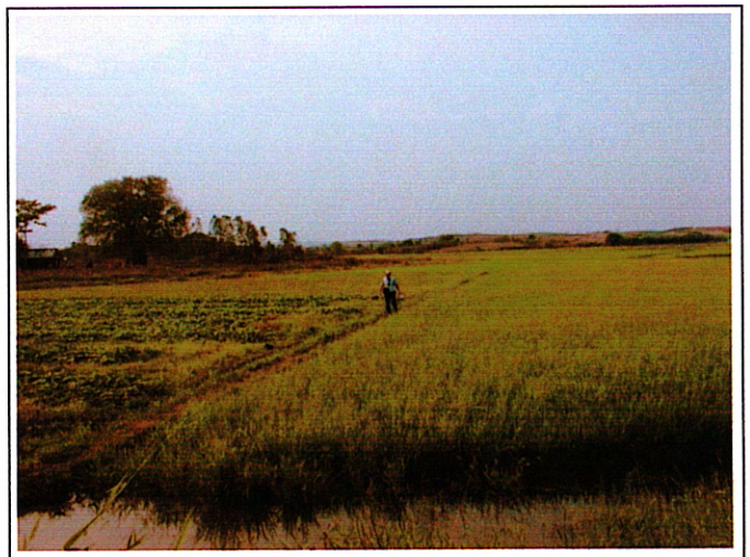
写真 2 : 取付道路予定位置