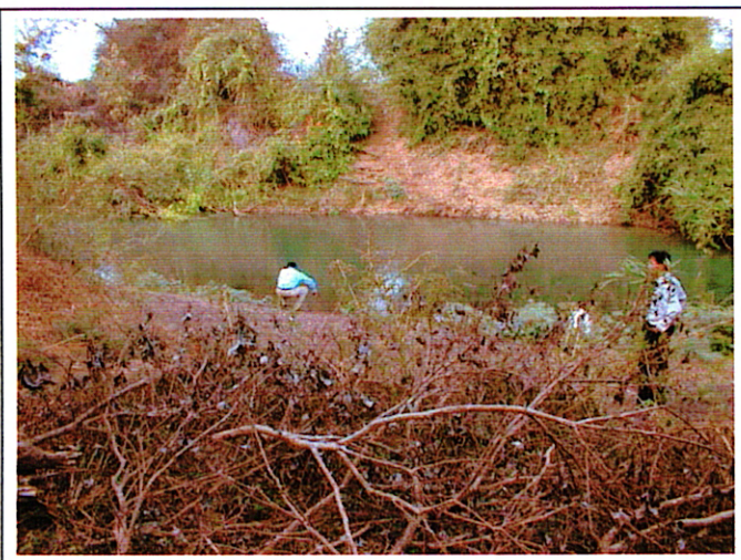
写真 1 : 架橋予定位置