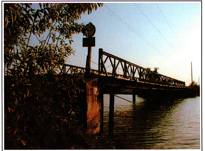
写真 2 : 現橋