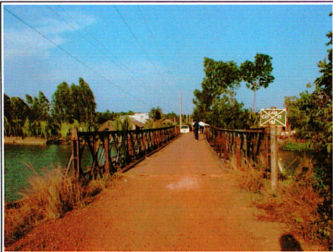
写真 1 : 現橋