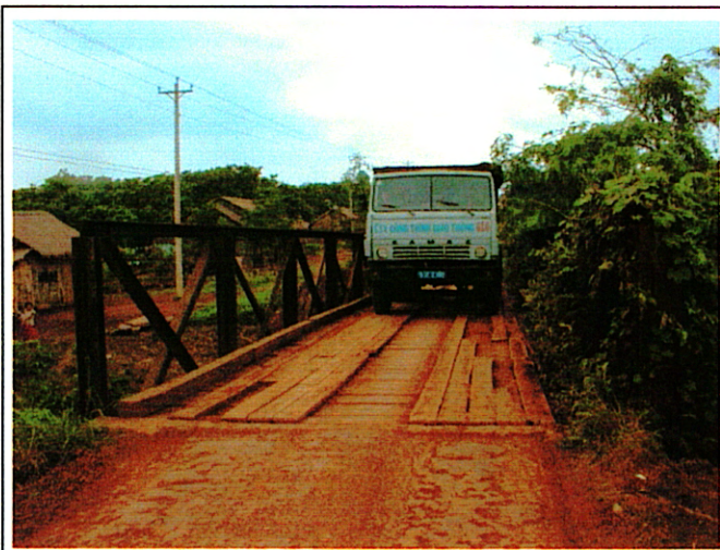
写真 1 : 現橋