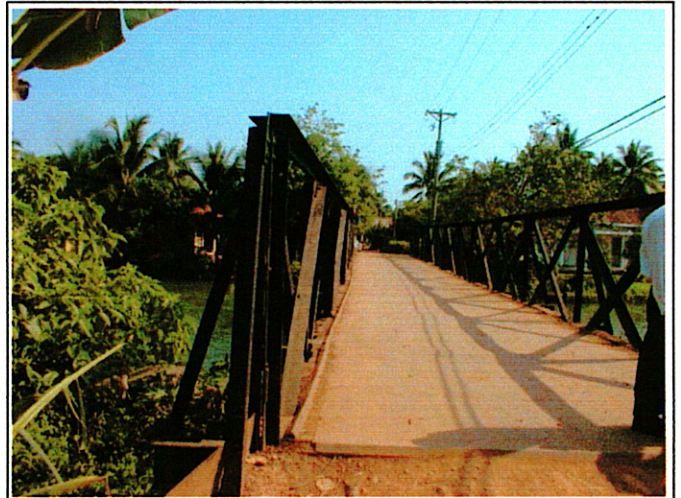
写真 2 : 現橋