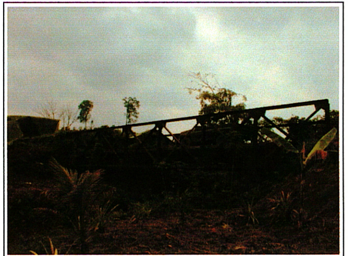
写真 2 : 現橋