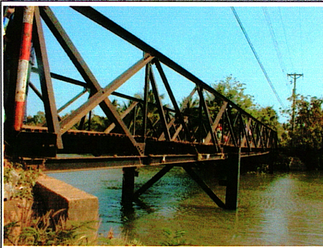
写真 1 : 現橋