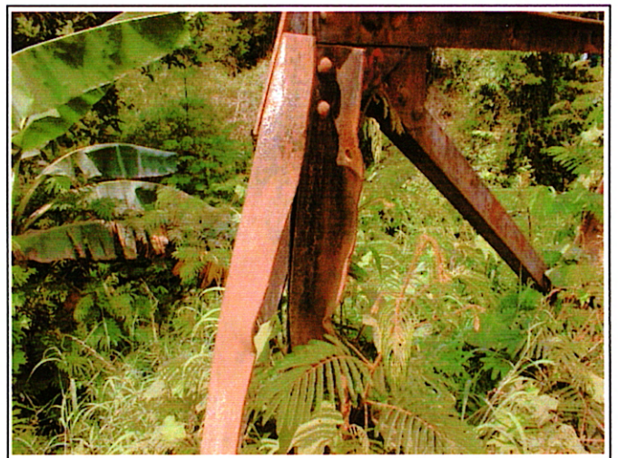
写真 2 : 現橋