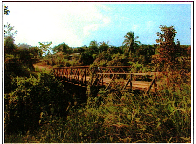
写真 2 : 現橋