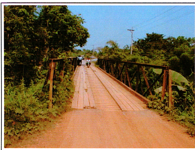
写真 1 : 現橋