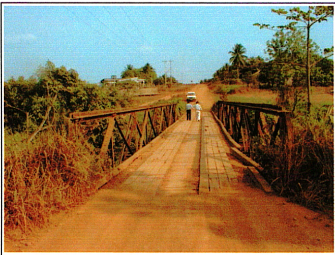
写真 1 : 現橋