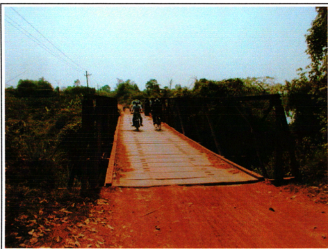
写真 1 : 現橋