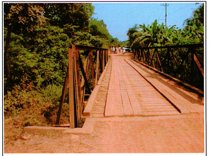
写真 2 : 現橋