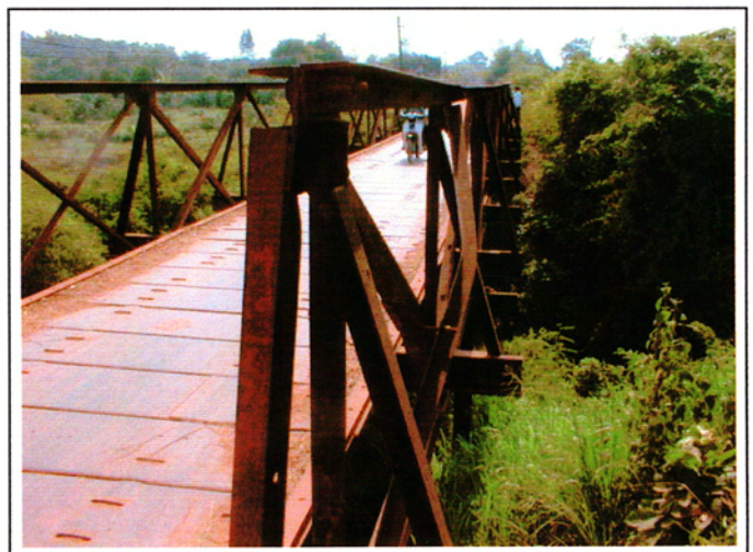
写真 2 : 現橋