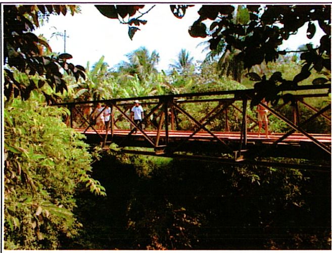
写真 1 : 現橋