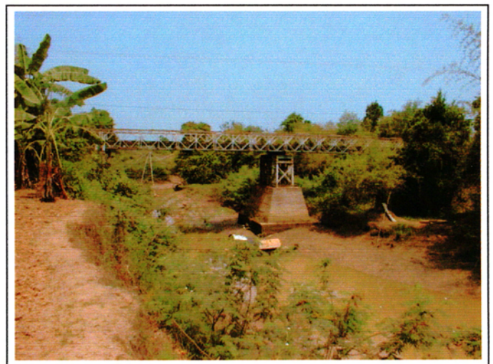
写真 2 : 現橋