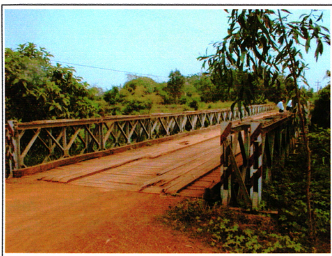
写真 1 : 現橋