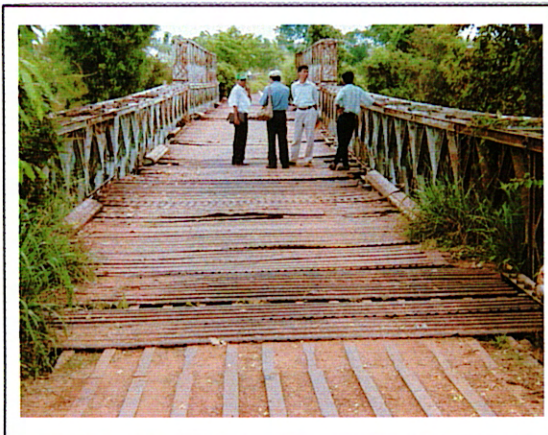
写真 1 : ①