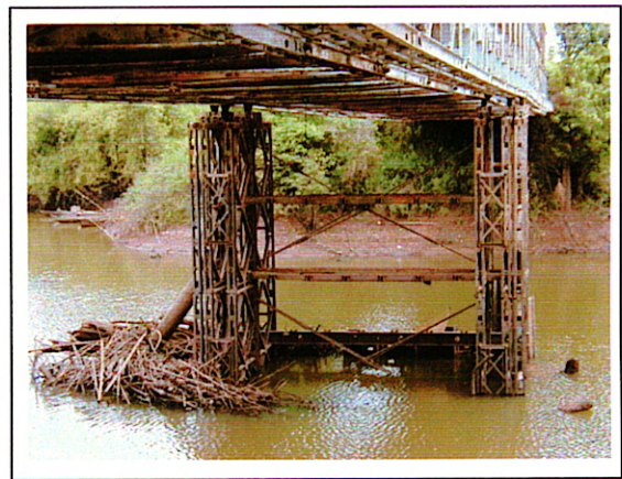
写真 2 : ②