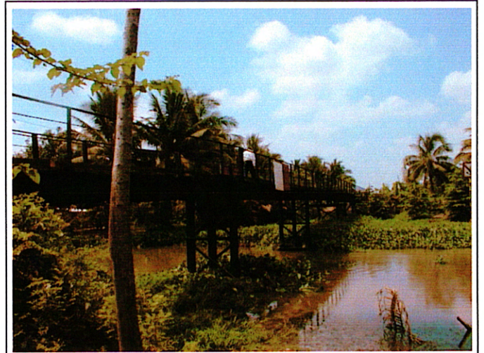
写真 2 : 現橋