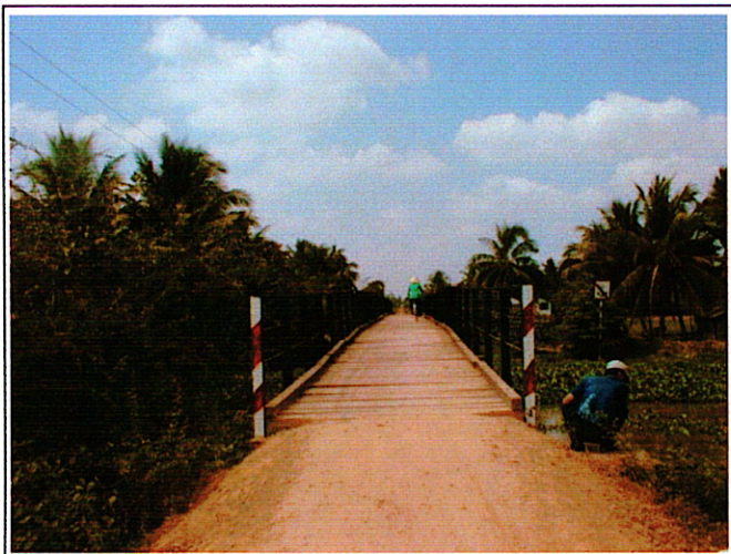
写真 1 : 現橋