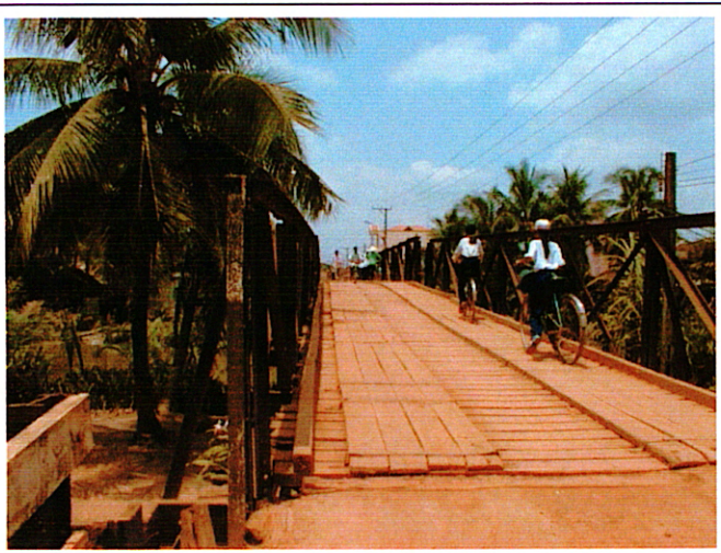
写真 1 : 現橋