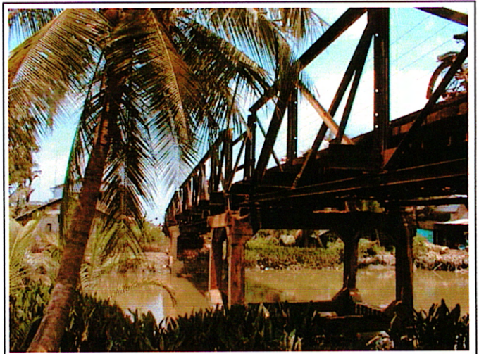
写真 2 : 現橋