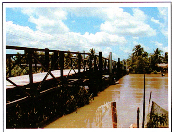
写真 2 : ②