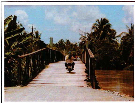
写真 1 : ①