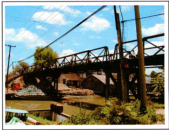
写真 2 : ②