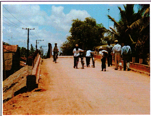
写真 1 : ①