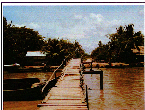
写真 2 : 道路側から橋を見る