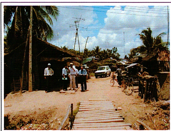
写真 1 : 橋から道路側を見る ①