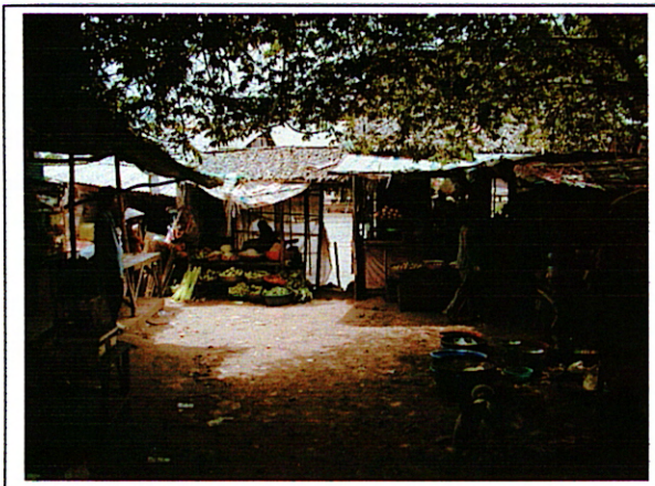
写真 1 : ①