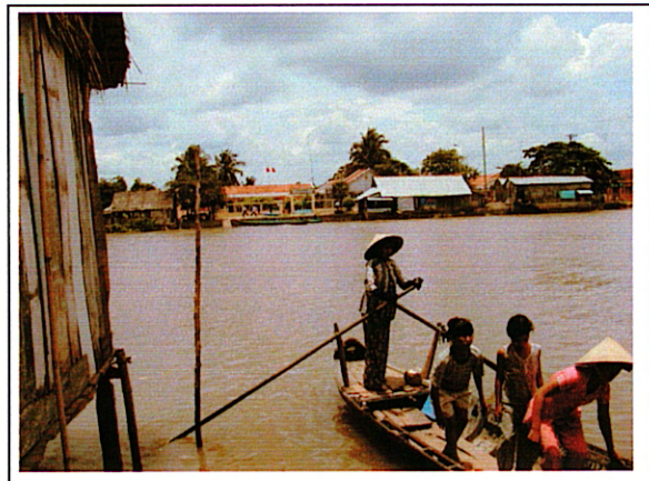
写真 2 : ②