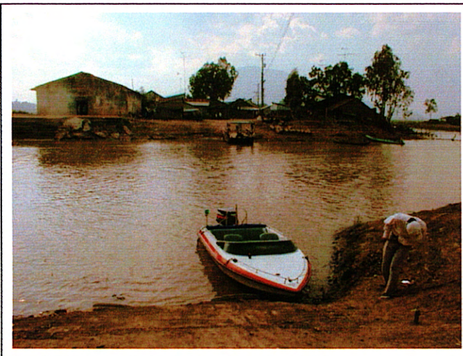
写真 1 : 架橋予定位置