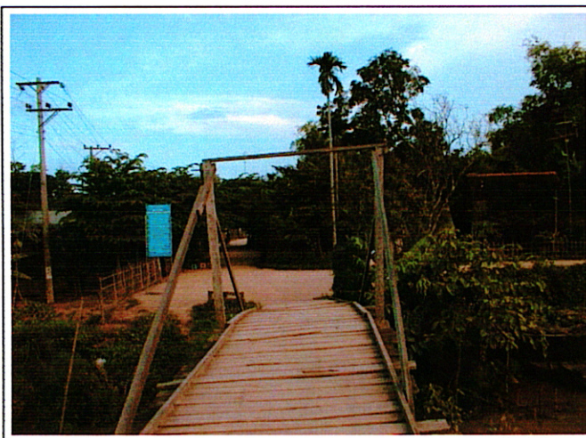
写真 1 : 現橋