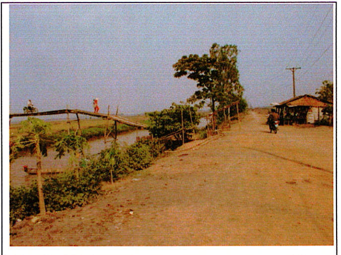
写真 2 : 取付道路