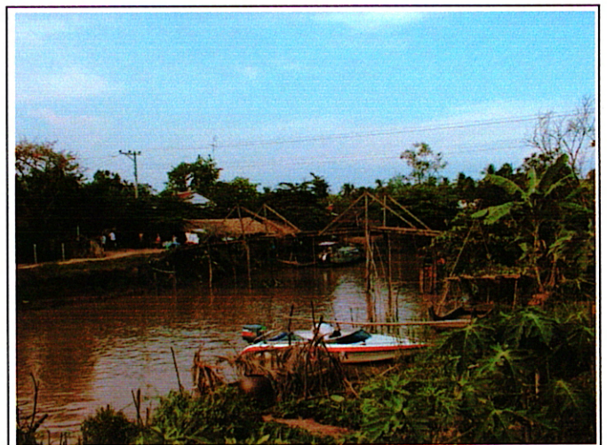
写真 2 : 現橋