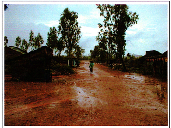
写真 2 : 取付道路