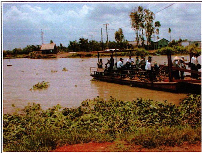
写真 1 : 架橋予定位置