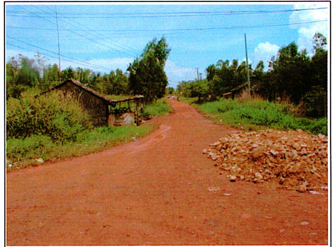
写真 2 : 取付道路