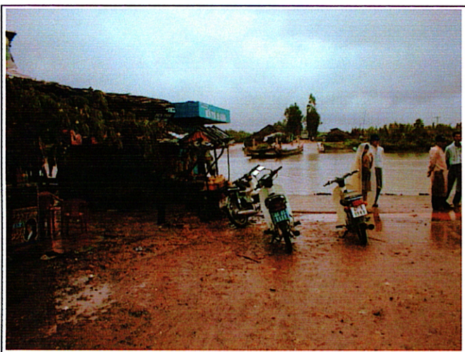
写真 1 : 架橋予定位置