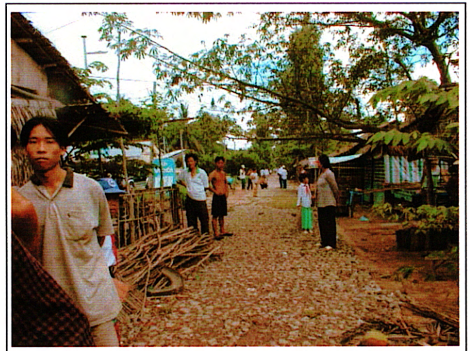
写真 2 : 取付道路