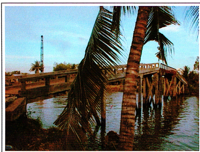
写真 1 : 現橋