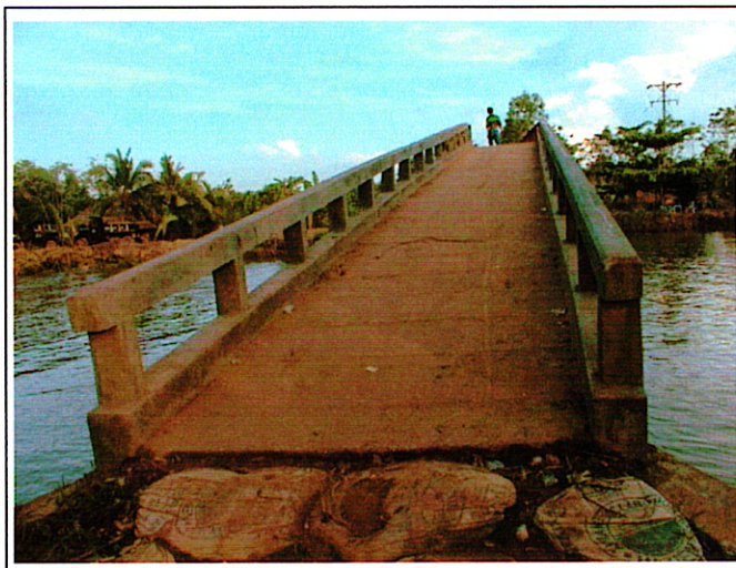
写真 2 : 現橋