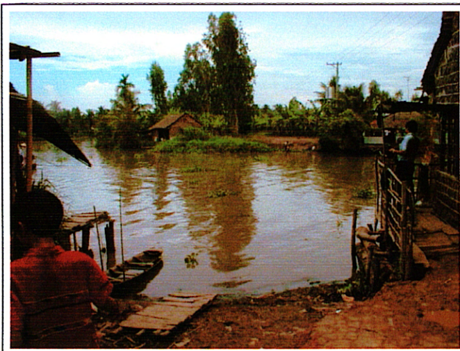
写真 1 : 架橋予定位置