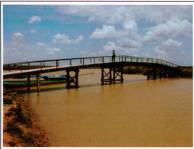
写真 1: 現橋