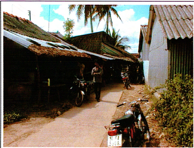
写真 1: 国道 1 号線対岸側