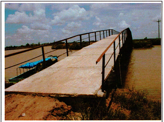
写真 2: 現橋