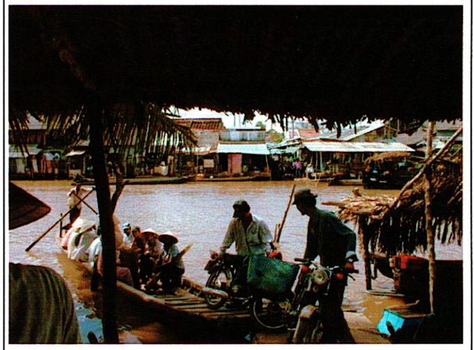
写真 2: 国道 1 号線側