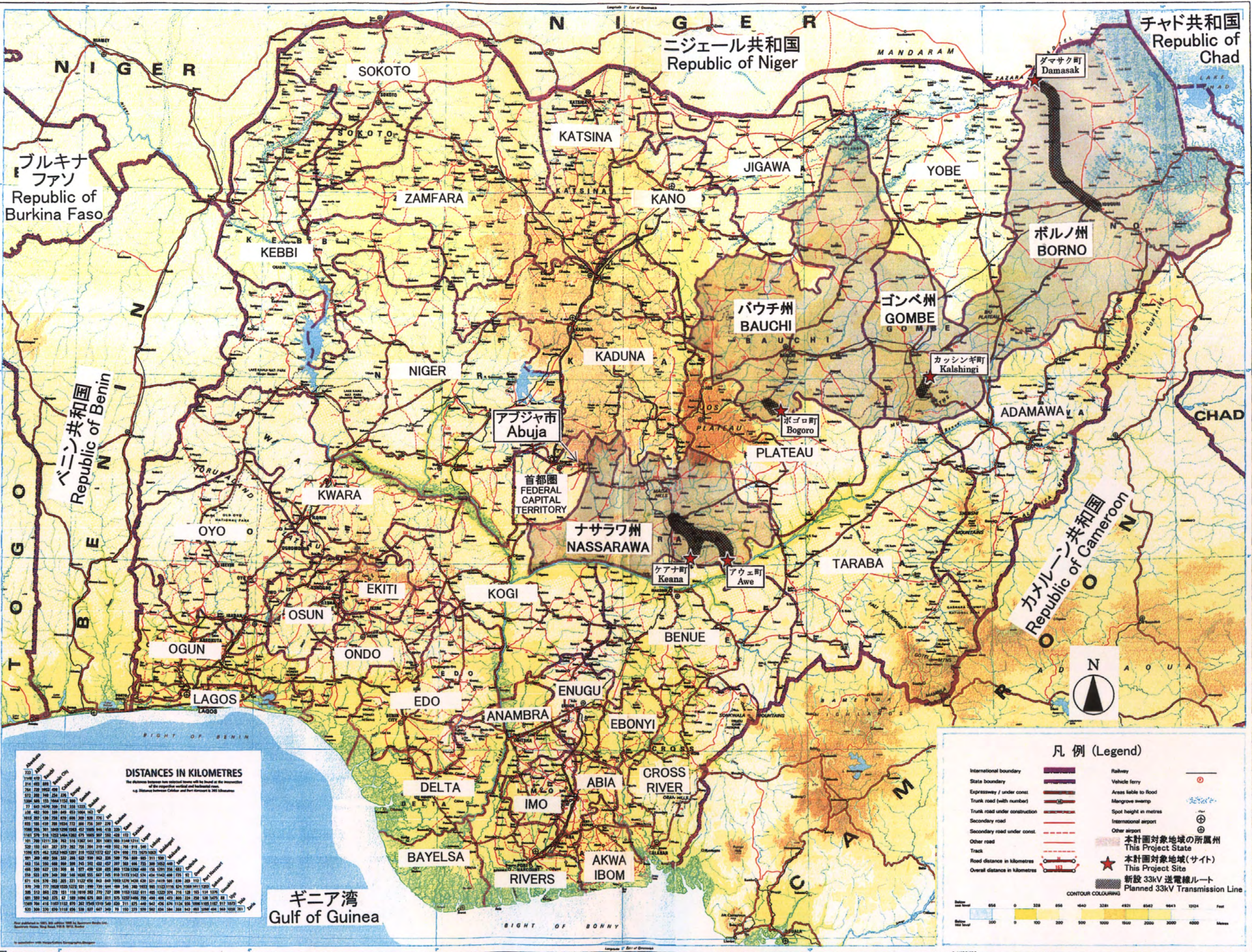
ナイジェリア連邦共和国全図 Map of Nigeria

1:1,500,000 スケール Scale 0 10 20 40 60 80 100km