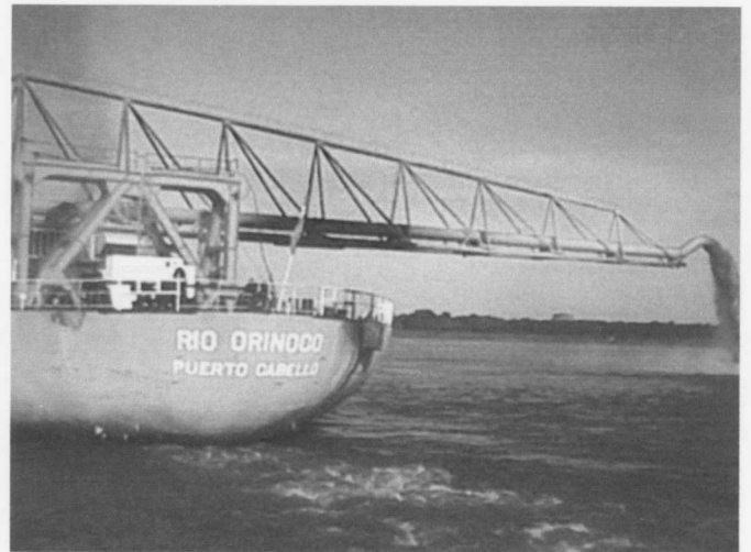
FOTOGRAFÍA - 12

La Draga Río Orinoco es de succión de arrastre, auto-propulsada, con un brazo de 86m de longitud, perpendicular a la draga para descargar fuera del canal.