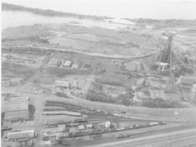
FOTOGRAFÍA - 7

Un pueblo industrial a lo largo del Río Orinoco en Puerto Ordaz.