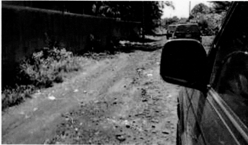
CREM へのアクセス道路