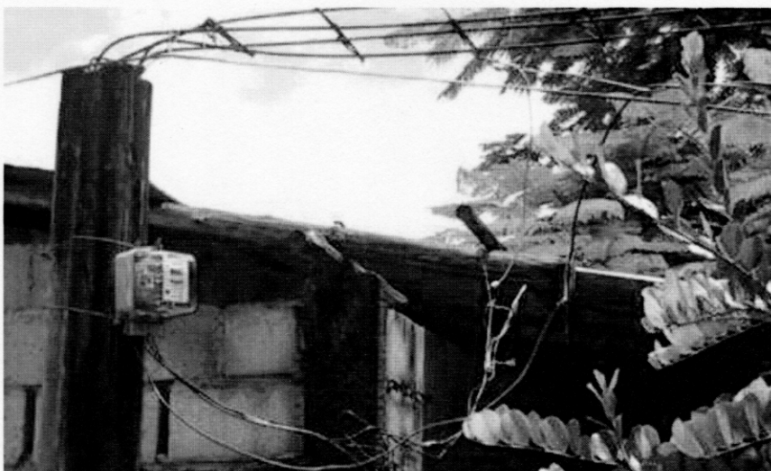
前進基地用地への電力取り込み