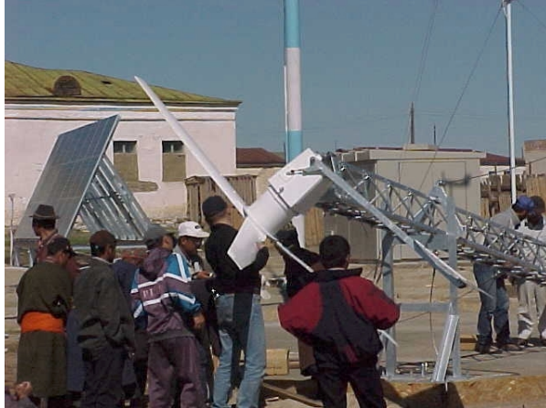
写真Ⅱ.1-8 組立完了した風力発電機と太陽パネル設備