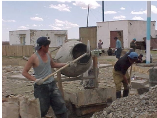
写真Ⅱ.1-2 コンクリート打ち