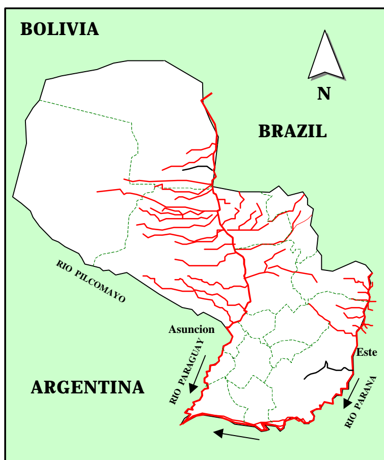
Figura 2.4.1 Hidrografía

En el oeste del país, el caudal de las aguas subterráneas es del oeste al este o sureste. En el este del país, sin embargo, el caudal es más complicado. Se aclara que aunque existan informes anteriores que reportan casos de inundación en algunas áreas de las rutas 2 y 7 en el pasado, la superficie de la ruta no se ha visto inundada recientemente.