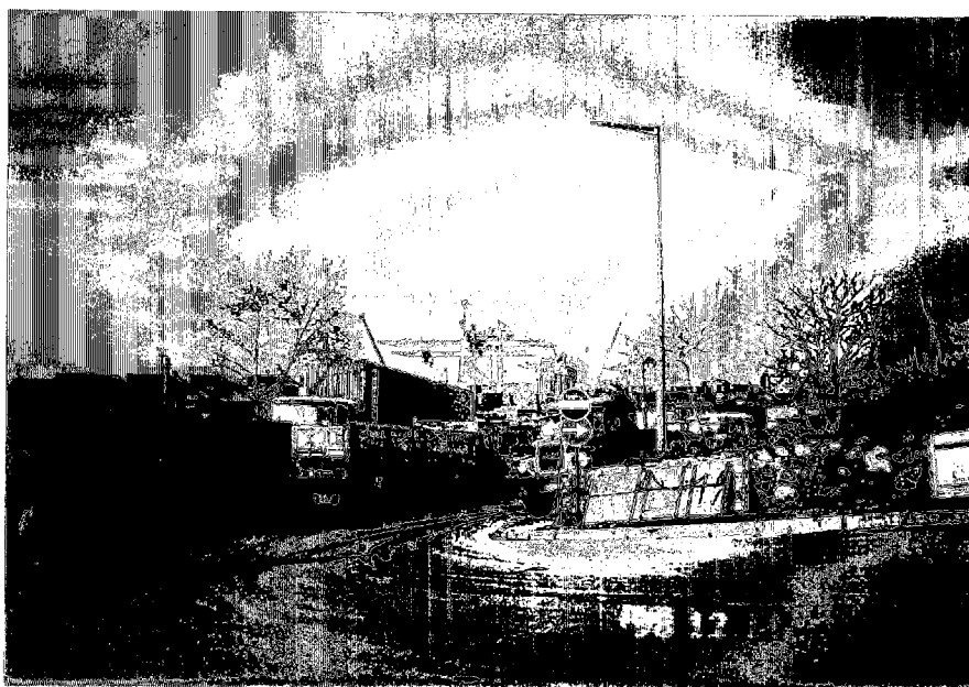
写真3 ハイデルパシャ港 背後が狭く、渋滞