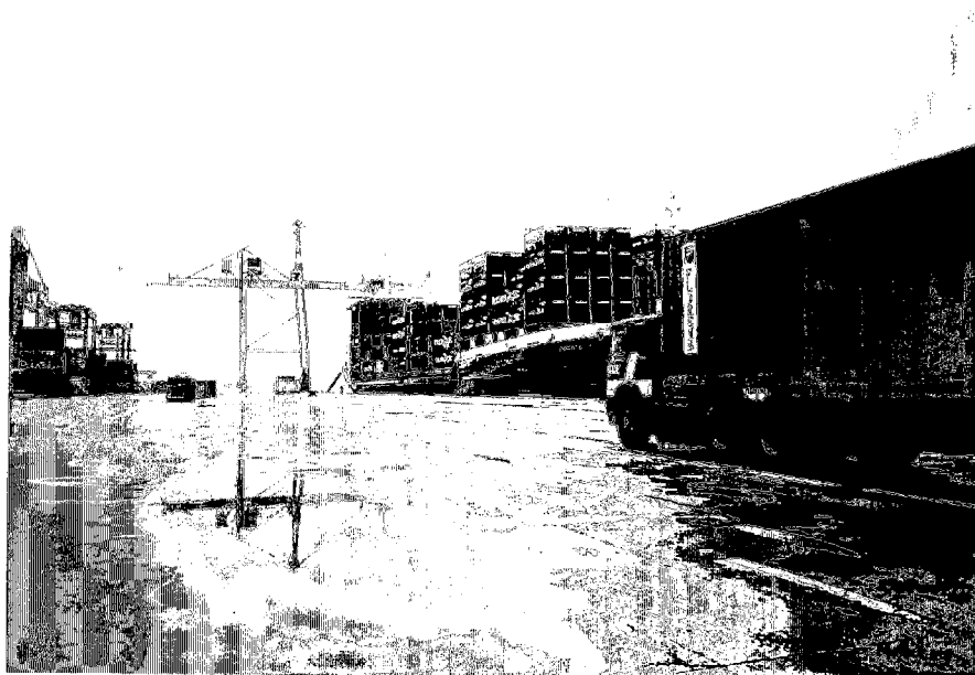
写真2 イズミール港 コンテナターミナル