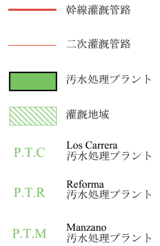
図 2.2.1 農業生産基盤整備計画図 (MALLARAUCO)