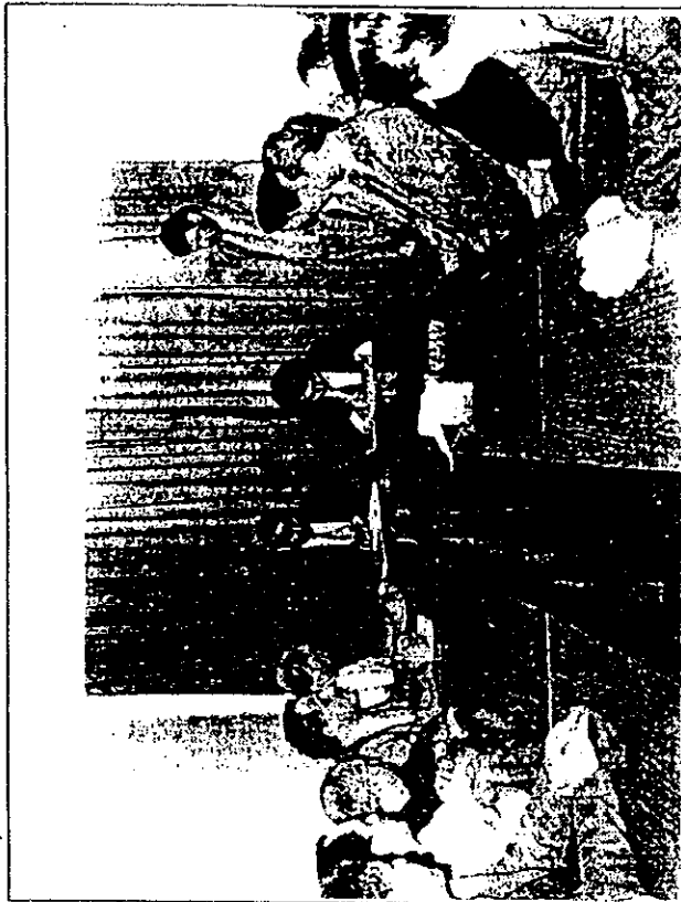
Vocational Training Corporation Director General Ali Nasrallah and a representative of the Japanese International Cooperation Agency sign minutes of their meetings on cooperation in training in the metal industries

Early this month a two-day workshop, organised by JICA in cooperation with the VTC and the Ministry of Labour, addressed the procedures of establishing a metal industries institute in the Kingdom.