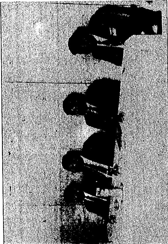
Minister of Labour Nader Abu Shaar (second right), Vocational Training Corporation Director General Ali Nasrallah and representatives of the Japanese International Cooperation Agency open a workshop on establishing a mineral industries institute in the Kingdom

The project hopes to execute goals laid out by a national plan designed to further develop vocational education and training.