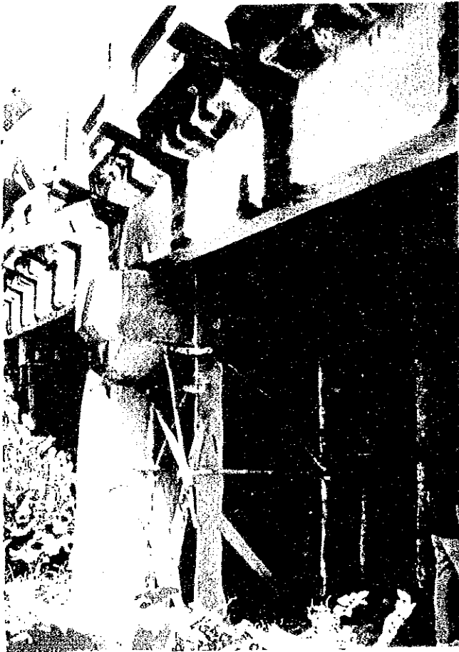
SULIBAO BR. STA. 1325+130