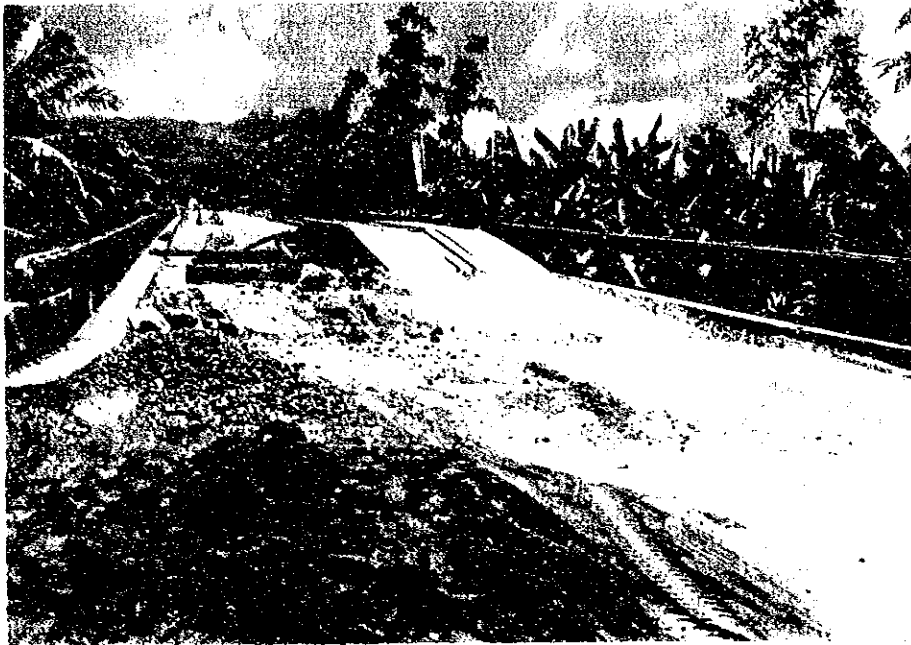
SULIBAO BR. STA. 1325+130