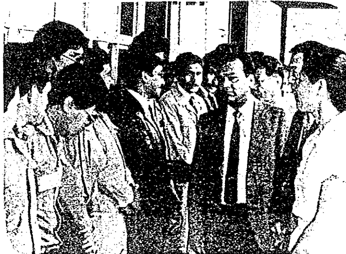
LOS MIEMBROS de la Misión Japonesa al CETMEJA aludieron a cada uno de los maestros de las diferentes tecnologías que en esta institución se imparten.

Se efectuó posteriormente un recorrido por las instalaciones del plantel, en las diversas áreas y especialidades que esta institución tiene desde su creación.