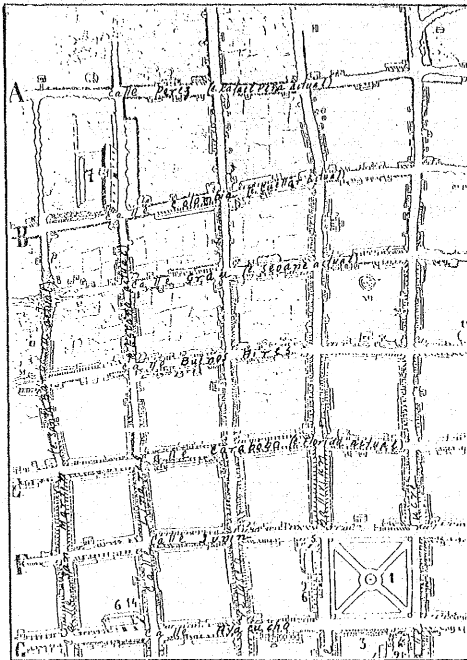
PLANO DE LA CIUDAD DE SANTA CRUZ LEVANTADO POR KONIG 1888

1.- Plaza de la Concordia 2.- Catedral 3.- Casa Gobierno 6.- Colegio Nacional 7.- HOSPITAL SAN JUAN DE DIOS.