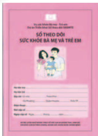
Carnet de santé de la mère et de l'enfant