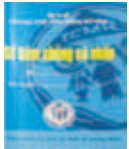
Carnet de vaccination